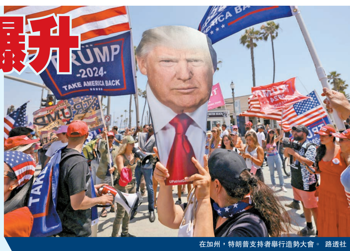
在加州，特朗普支持者舉行造勢大會。

【香港商報訊】在周末特朗普槍擊事件後，「特朗普交易」繼續加碼。美股15日開市後，特朗普媒體科技集團、Phunware以及Rumble等特朗普概念股集體大漲。分析師預計，特朗普獲勝的情境對美股後續走勢整體也是利好因素，尤其是金融股、能源股等將受益於特朗普政策的行業類股，但短期美股波動性料將加劇。