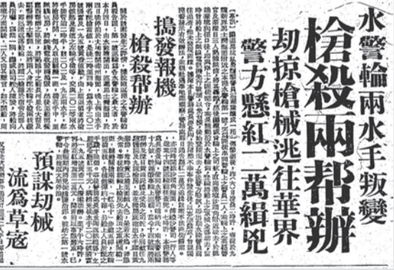
1949年5月7日報章報道一號水警輪水手殺警奪槍案件。