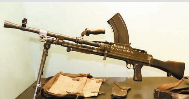
被劫去的編號HKP004輕機槍現於警隊博物館展出。

而案中被告去的一挺編號HKP004輕機槍，輾轉於1953年的韓戰戰場中被參戰的英軍在戰場上檢獲，先後被英軍三個軍團使用，最後送返香港警方，現於香港警隊博物館展出。