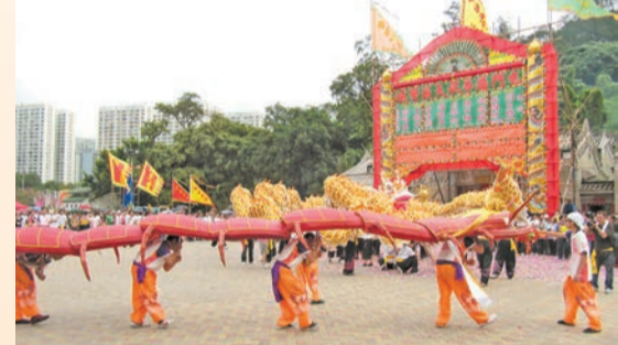
◀蜈蚣模樣像真，長180呎。