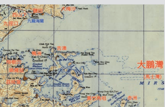
1950年代的馬士灣即大鵬灣地圖，筆者加上紅字標註相關地名。