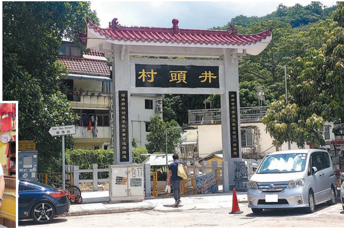
▲去年落成的井頭牌坊位於新秀街，這是村落內街，並不在青山公路邊，公眾難以看見。