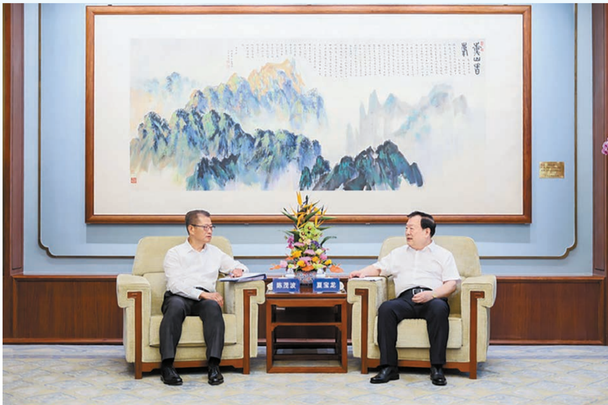
夏寶龍在北京會見香港特區政府財政司司長陳茂波一行。