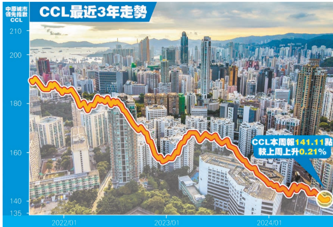
業主觀望減息，樓市繼續拉鋸受壓，代理預期整體樓價跌勢不變。資料圖片

細分不同類型指數，中原城市大型屋苑領先指數(CCL Mass)報141.52點，按周升0.20%。CCL(中小型單位)報140.17點，按周升0.13%。CCL Mass及CCL(中小型單位)齊結束6周連跌，並同樣於近8年低位徘徊，重返2016年9月底水平。CCL(大型單位)