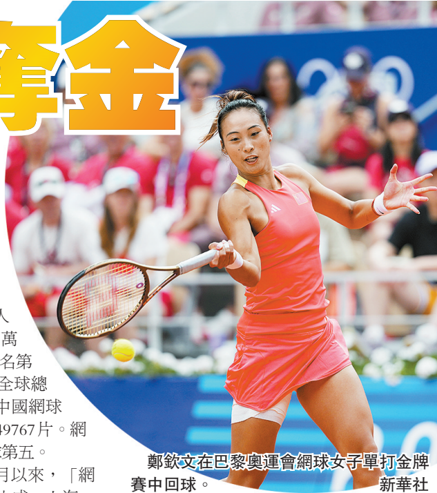
鄭欽文在巴黎奧運會網球女單打決賽中回球。

朝陽公園網球中心的工作人員說。除了朝陽公園，今年以來，北京、上海、廣東、湖北等多地網球場出現漲價的情況。