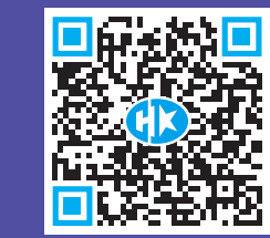
掃碼睇巴黎奧運專題

【香港商報訊】北京時間8月4日凌晨結束的巴黎奧運會網球女單決賽中，中國選手鄭欽文戰勝對手，奪得金牌，創造了中國網球的歷史。而在北京時間3日凌晨舉行的奧運會網球混雙決賽中，中國組合張之臻/王欣瑜獲得銀牌，同樣創造了中國網球在這個項目上的歷史。