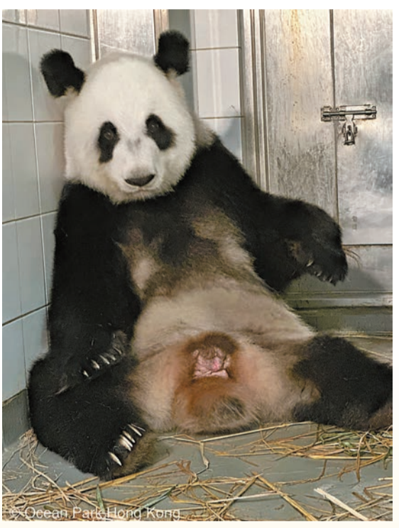
►大熊貓盈盈準備分娩。

李家超：別具意義 行政長官李家超表示：「今年是中華人民共和國成立七十五周年，『盈盈』和『樂樂』為香港誕下首對可愛的大熊貓，別具意義。我們再一次衷心感謝國家向香港特區送贈大熊貓，充分顯示對香港特區的關心和支持。我們亦感謝海洋公園團隊多年來對大熊貓『安安』、『佳佳』、『盈盈』和『樂樂』的悉心照料，以及中國大熊貓保護研究中心的專家一直以來的大力支持，讓大熊貓『盈盈』和『樂樂』得以在香港誕下一對龍鳳胎。」 特區政府表示，這段時期是新生大熊貓寶寶的健康關鍵時刻。海洋公園動物護理專業團隊聯同中國大熊貓保護研究中心的專家正不分晝夜悉心照料「盈盈」及兩位寶寶，直至牠們的狀況完全穩定。 另一方面，香港海洋公園隨後亦發布喜訊，指「盈盈」於2024年8月15日、亦即牠19歲生日前一天，成功誕下一隻雌性和一隻雄性大熊貓寶寶，分別是姊姊和弟弟。