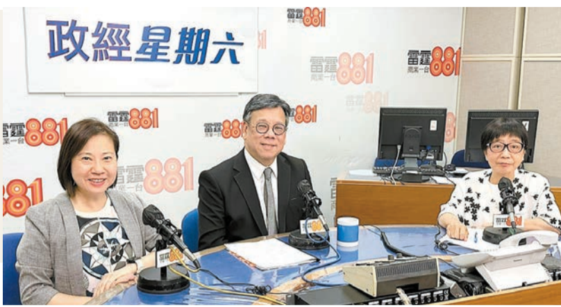
商務及經濟發展局局長丘應樺昨日接受電台訪問時表示，中小企百分百擔保貸款計劃暫時無意重推。

【香港商報訊】記者萬家成報導：近期相繼有中小企反映經營困難，坊間擔心出現結業潮，金管局與銀行公會日前成立中小企融資專責小組，全力支援中小企解決融資困難問題。對於商界建議重推「中小企融資擔保計劃」下「百分百擔保特惠貸款」，商務及經濟發展局局長丘應樺昨早在電台節目表明，中小企百分百擔保貸款計劃是疫情時期的特別措施，壞帳達132億元，暫時無意重推。他又提到，政府設有多項專項基金協助企業升級轉型，建議商界發展電商市場。