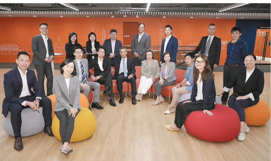
「高級公務員公共管理碩士課程」第三屆共16名學員將於下月初到北京開展學習之旅。

【香港商報訊】記者周偉立報導：公務員事務局局長楊何蓓茵昨日在社交平台表示，特區政府與北