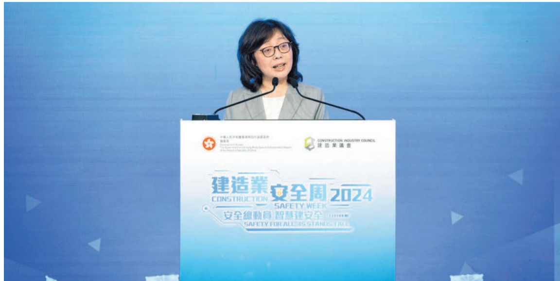
甯漢豪昨出席「建造業安全周2024」開幕典禮上致辭。

發展局重申，政府在投資基建方面決心不變，未來工程量亦會較過去增加，基本工程開支每年達900億元，較過去5年平均增加17%。為協助建造業改善