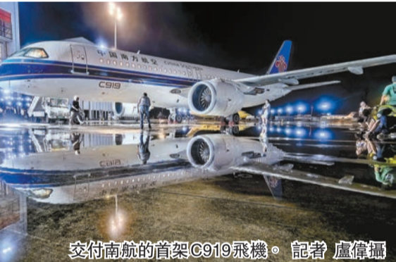
交付南航的首架C919飛機。

國航、南航頒發《飛機銷售證》並移交飛機交付紀念鑰匙，中國民航局向國航、南航頒發《國籍登記證》《單機適航證》和《無線電台執照》。國航C919首架機為延程型，採用158座兩艙布局，包含8個公務艙和150個經濟艙。南航C919首架機為標準航程型，採用164座三艙布局，包含8個公務艙、18個明珠經濟艙和138個經濟艙。兩架飛機均裝配了定製化的客艙座椅等設施設備，全艙配置個人充電接口，為乘客提供便捷舒適的乘機體驗。 為保障C919飛機順利引進和後續順暢運營，國航、南航與中國商飛緊密合作，全力推進飛機選型、生產監造、人員培訓、運行準備等各項工作。