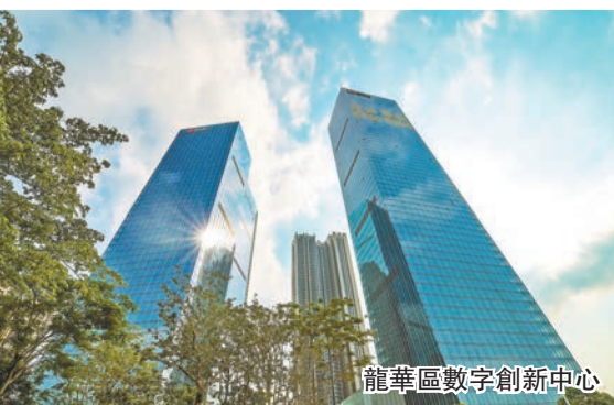
龍華區數字創新中心