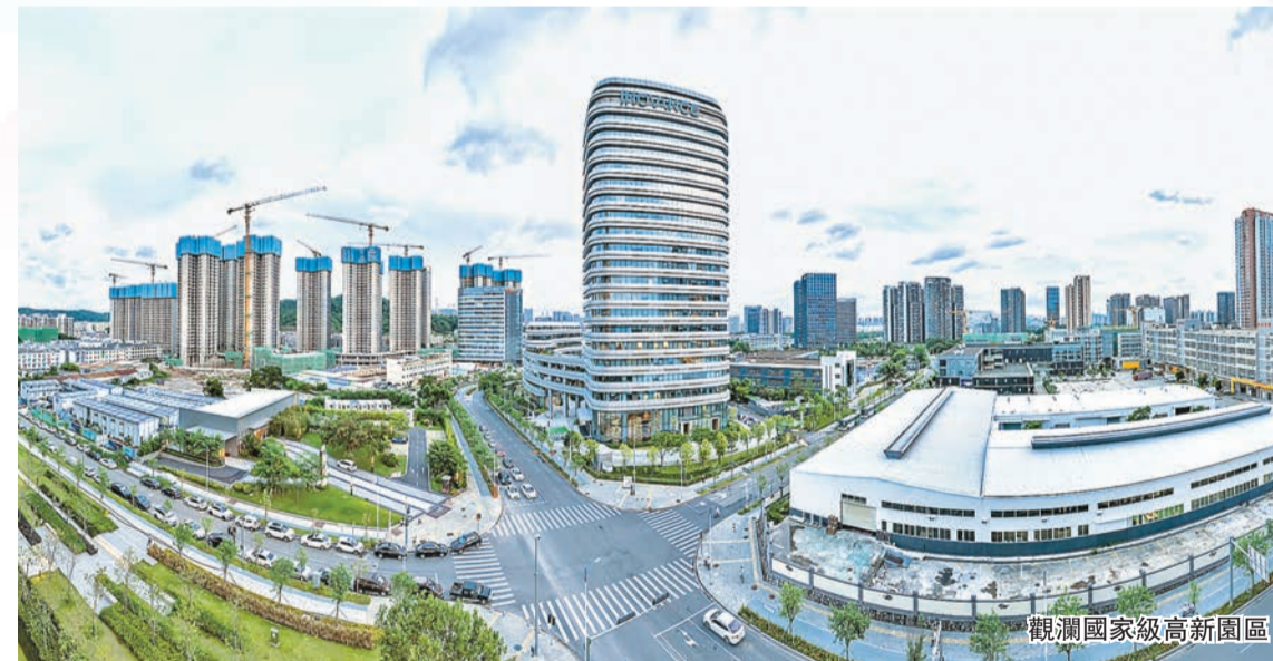
觀瀾國家級高新園區

對此，深圳龍華區率先出台《龍華區低空經濟試驗區2024年度建設方案》，為低空經濟勾勒具體實