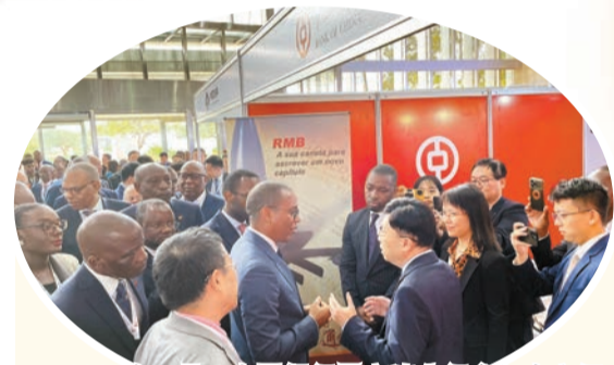
2023年7月，中國銀行羅安達分行參加中安經貿合作論壇，承辦「經濟多元化和吸引外國直接投資」分論壇。

埃塞俄比亞「對話、研究與合作中心」執行主任阿卜德塔·貝耶內表示，非盟的《2063年議程》與共建「一帶一路」倡議可以找到契合之處，在這兩個框架下可以有更好的機會助力非洲實現轉型。他認爲，在參與「一帶一路」倡議的項目中，來自中方的貸款是經濟、可行的，同時能很好符合當地的需求。