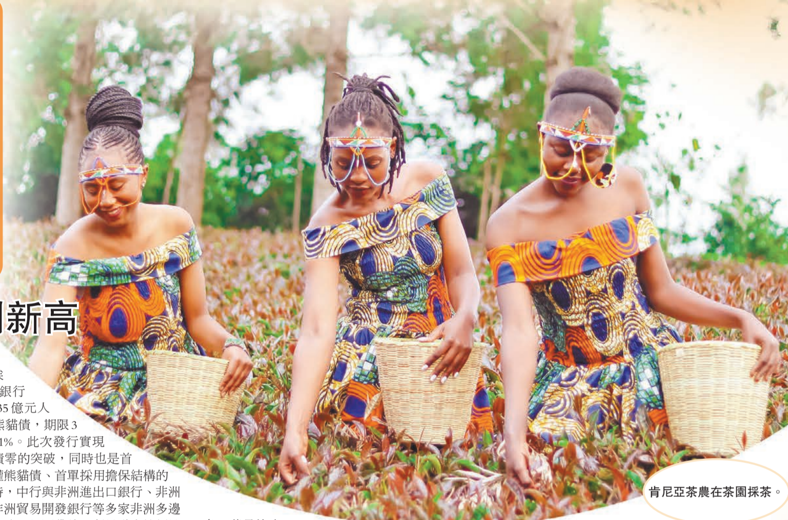
肯尼亞茶農在茶園採茶。