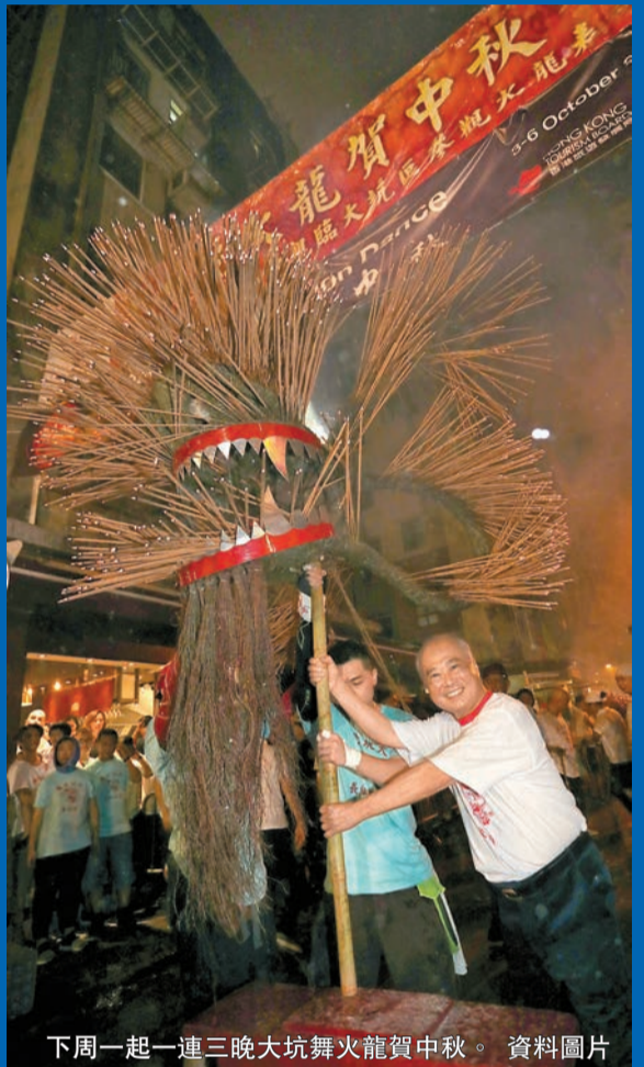
下周一起一連三晚大坑舞火龍賀中秋。

此外，兩架發光電車(Bright Ring Tram)已換上火舞巨龍新裝穿梭港島各處，配合中環半山扶手電梯、港鐵站電子屏幕、旅發局機場及九龍旅客諮詢中心等旅客熱點換上火龍主題，猶如火龍躍出大坑，走入街頭巷隅，煥發全城中秋氣氛。