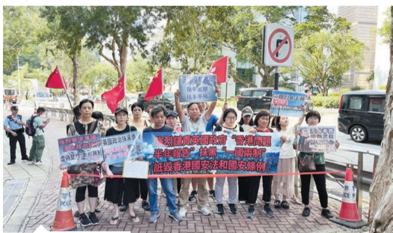
有市民到英國駐港總領事館請願，譴責英國詆毀香港國安法。

昨日，一批市民和團體先後到英國駐港總領事館請願，強烈譴責英國發表所謂報告，指斥該報告抹黑「一國兩制」、詆毀香港國安法和國安條例，他們敦促英國尊重國際法和國際關係基本準則，尊重香港由治及興的事實，停止發表所謂半年報告。