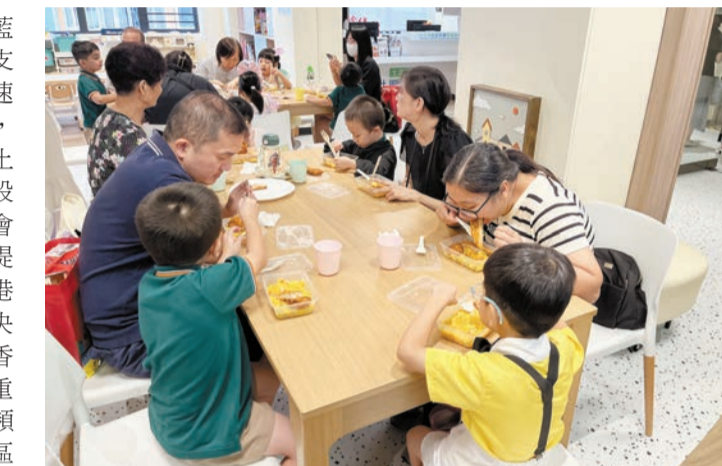
基層家庭可在寬廣的共享飯廳內進食。

據介紹，土瓜灣社區客廳有很多設施，如共享備餐間，有 8 組煮食設備與廚具。自助洗衣間提供 4 部洗衣機與 4 部乾衣機，每機收費 8 元，兩者供會員預約使用，另外特設兩個音樂練習室讓基層家庭能預約使用，多媒體工作間供會員製作短片或錄音，運動室配備基本健身運動器材，推廣健康運動習慣。兒童遊戲室放置玩具、繪本和各種圖書。育嬰室提供母乳餵哺友善空間，讓媽媽進行母乳餵哺與照料嬰兒。