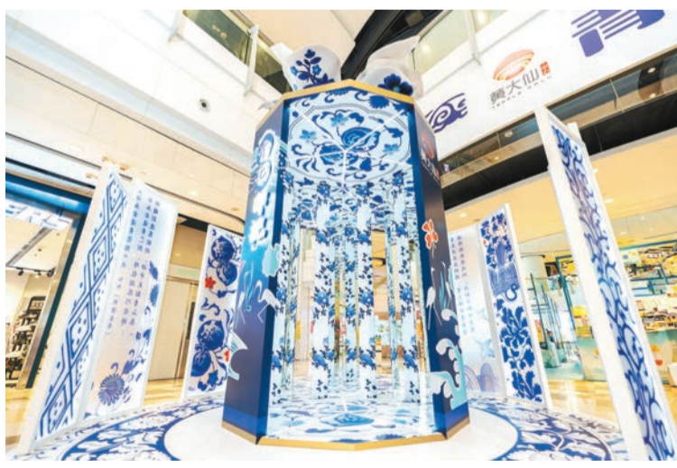
近 4 米高的「萬花筒」打卡裝置。上方裝置一朵巨型陶瓷花，旁邊是古典氣息濃厚的青花屏風，令人沉浸於青花瓷的藝術氛圍中。