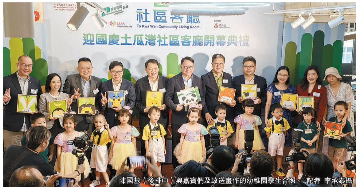
陳國基（後排中）與嘉賓們及致送畫作的幼稚園學生合照。

【香港商報訊】記者唐信恒報道：土瓜灣社區客廳昨日舉行開幕典禮。政務司司長陳國基出席典禮時表示，土瓜灣社區客廳計劃是現時最大的社區客廳，實用面積接近 7000 平方呎，預計可以服務 600 個劊房戶，全年服務人次約 9 萬。