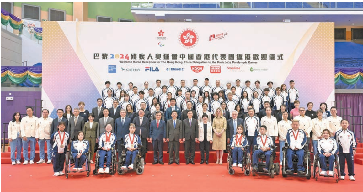
政府昨日舉行巴黎2024殘奧會中國香港代表團返港歡迎儀式，祝賀代表團載譽歸來。

李家超續說，特區政府一直支持殘疾人士體育發展，投放在支援殘疾運動員的資源亦持續增加。今個財政年度，政府投放於推動殘疾人士體育發展的