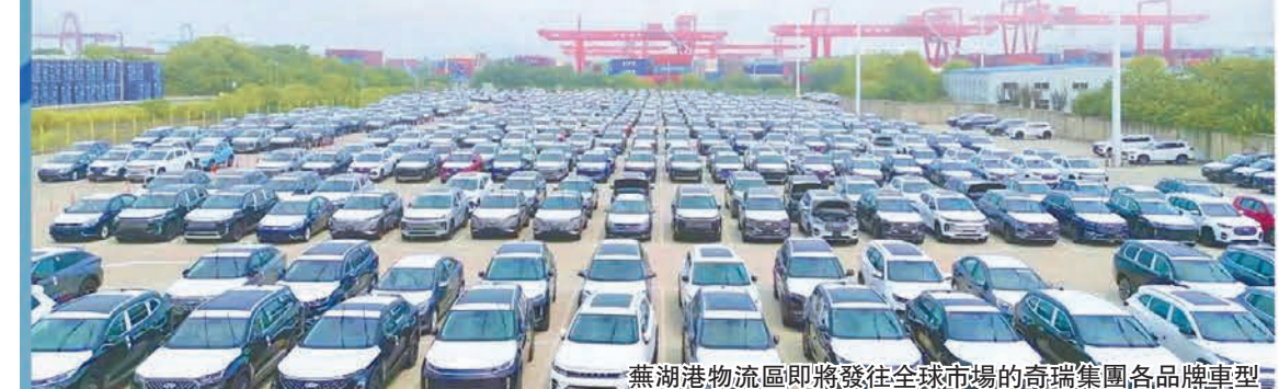
蕪湖港物流區即將發往全球市場奇瑞集團各品牌車型