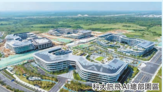
科大訊飛AI總部園區

大會圍繞新中國成立75周年主題，設置序廳、國際展示、大國製造展示、主賓省（市）展示、外省（區、市）製造業高質量發展成就展示、安徽省新型工業化發展成就展示等板塊，面積2萬平方米，將集中展示世界首台25MW海上風電機組主軸軸承、京華號泥水平衡盾構機等全球製造業領域最新成果，展示「啓辰」二號人形機器人、九州雲箭「龍雲」火箭發動機、「本源悟空」超導量子計算