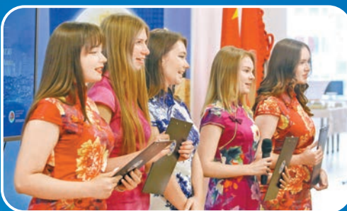
白俄羅斯中國文化愛好者在明斯克朗誦以月亮為主題的詩歌。 新華社