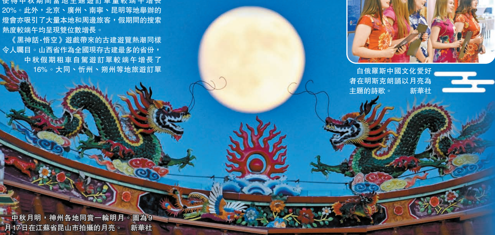
中秋月明，神州各地同賞一輪明月。圖為9月17日在江蘇省昆山市拍攝的月亮。

此外，形式多樣的慶中秋活動在多國舉行。「中國風，尼泊爾情」主題專場文藝演出在尼泊爾首都加德滿都舉辦；在新西蘭南島最大城市克賴斯特徹奇，來自湖北藝術團的演員在中秋詩韻晚會上帶來獨具荆楚文化特色的歌舞、器樂合奏等表演；「天涯共此時——中秋詩會」在緬甸仰光舉行，緬甸高校學生及中資企業僱傭員工等近150人共賞詩句朗誦、京劇等表演，參加月餅製作、書法展示等體驗活動；在斯里蘭卡首都科倫坡，來自孔子課堂的學生們在中秋詩會上朗誦詩詞，中方演員帶來斯里蘭卡歌曲《罐舞》等節目，展現了中斯文明的交流互鑒。