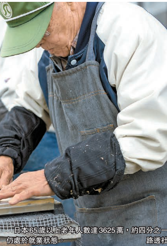
日本65歲以上老年人數量3625萬，約四分之一仍處於就業狀態。

命大幅提高，也為推遲退休年齡創造了空間。赫爾曼指出，日本的人口老齡化已經轉化為人口下降，進一步加劇了對社會保障體系、服務和基礎設施的挑戰。赫爾曼表示，而且這些變化是在快速技術變革和數碼化的背景下發生的，人口變化和技術變革正在從根本上重塑勞動力市場，這需要決策者作出更深入、更廣泛的政策回應。