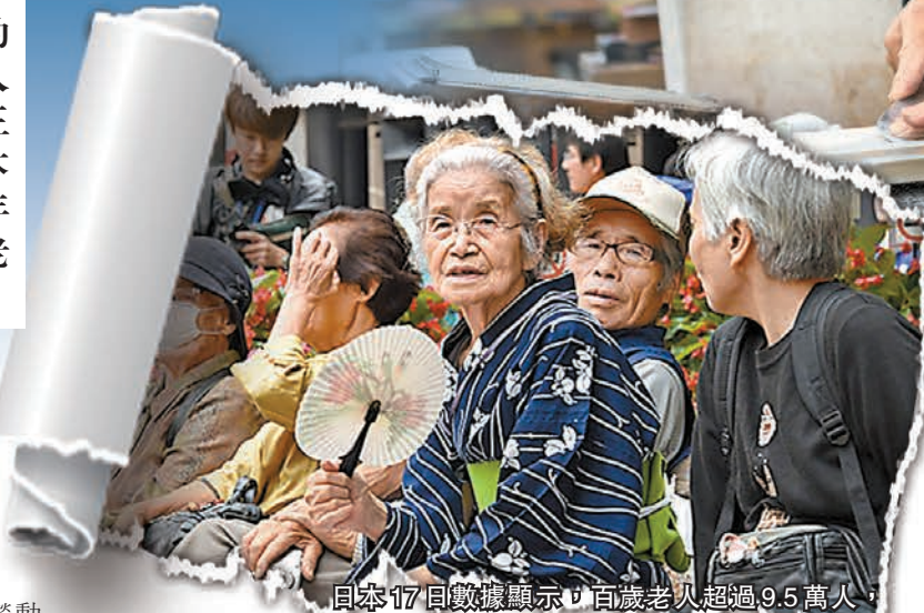
日本17日數據顯示，百歲老人超過9.5萬人，連續64年創新高。

為應對老齡化問題，日本政府早在50年前就推出了相應的法律制度安排，即1971年出台的《促進老年人就業穩定法》，旨在提高60歲以上年齡段人口的就業率，1986年日本對該法案進行了修訂，並將其更名為《高齡者僱傭安定法》。隨後，日本不斷