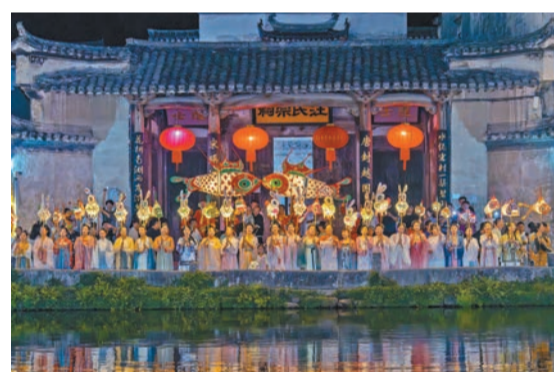
中秋宏村月滿奇妙夜燈巡遊活動。

【香港商報訊】記者吳敏 通訊員何彥銘、程夢君、洪宛柔、崔艷、姚靖雯報道：中秋假期，安徽黃山市成爲旅遊市場熱點，各地遊客紛至沓來，享受假日時光、佳節美好，實現旅遊人次與旅遊收入雙躍升。