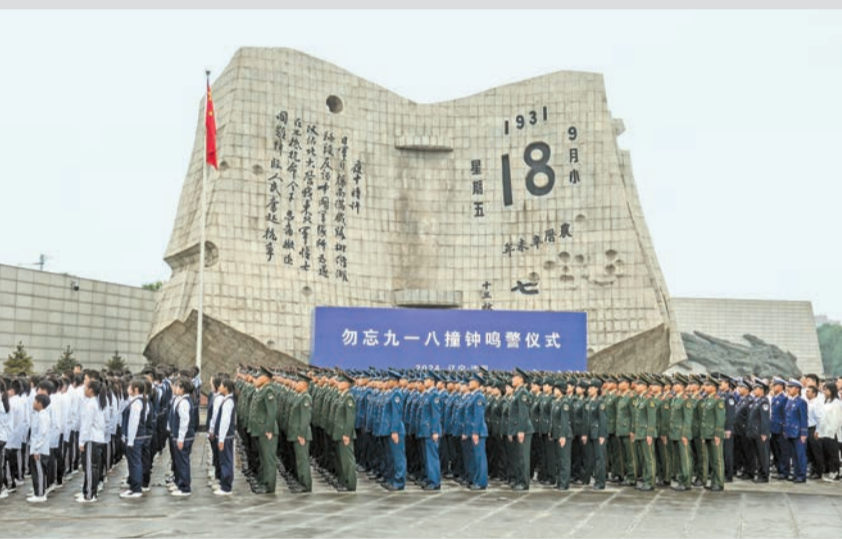
9月18日上午，「勿忘九一八」撞鐘鳴警儀式在瀋陽「九一八」歷史博物館殘廢碑廣場舉行。

【香港商報訊】據綜合消息，今年9月18日是「九一八事變」爆發93周年紀念日。中國多地，包