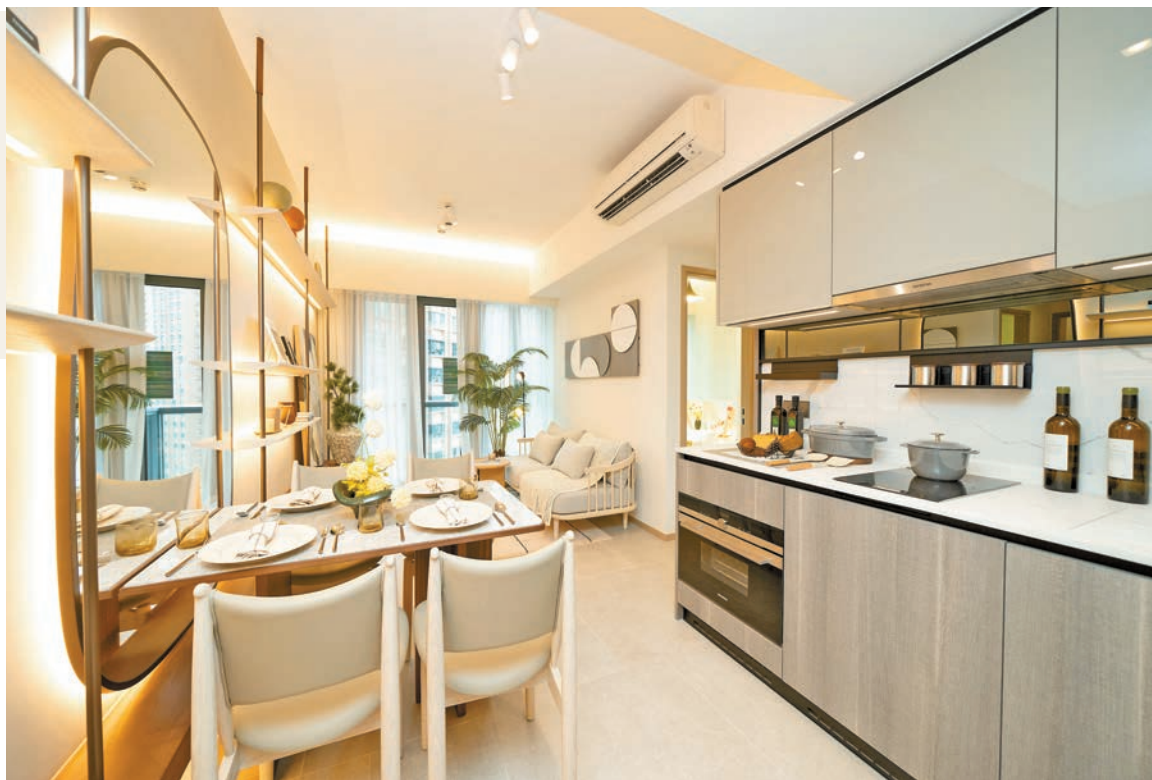
新地表示會視乎接收票反應決定銷售部署，YOHO Hub II有機會於下周推售，圖為該盤示範單位。

【香港商報訊】記者陳薇報道：新地(016)元朗YOHO Hub II昨起開放全新第6座現樓示範單位參觀，現場人頭湧湧，吸引逾2000人次參觀。據悉，有關項目將於本周五(20日)正式接收購樓意向登記，將視乎接收票反應決定銷售部署，有機會於下周開始推售。