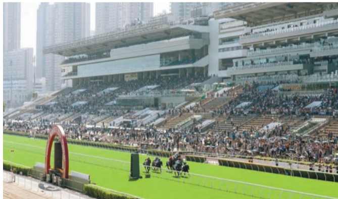
香港賽馬會將於10月1日辦「國慶賽馬日」賀國慶75周年，當日市民可免費進入馬場公眾席。

旅客免費參加沉浸式VR虛擬遊覽從化馬場了解馬場設施 互動裝置體驗騎師訓練訪港客人入場後，只需到訪「遊客專區」並開設投注戶口，即可免費參加指定馬場導賞，從中了解香港賽馬文化與歷史。導賞活動包括「遊覽」從化馬場，透過VR虛擬遊覽位於廣州的