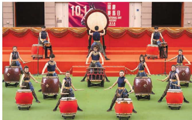
本地年輕粵劇武打演員聯同著名鼓樂團《激鼓》的精彩表演。

從化馬場，以第一身視角遊覽世界級馬匹訓練設施，走訪馬房了解馬匹的日常生活；更可化身為騎術學生，透過互動設施體驗騎師的日常訓練，從另一角度體驗賽馬的樂趣；透過觀賞珍貴片段，認識賽馬會的百年歷程；另外，旅客亦可到訪數碼專區感受互動賽馬，並參與 Racing 101加深對賽馬的認識。