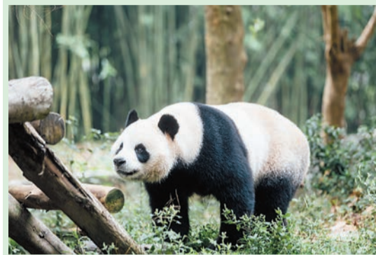
「安安」體形較大，同樣好動活潑。