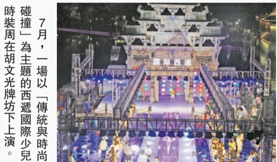
7月，一場以「傳統與時尚碰撞」為主題的西遞國際少兒時裝周在胡文光牌坊下上演。