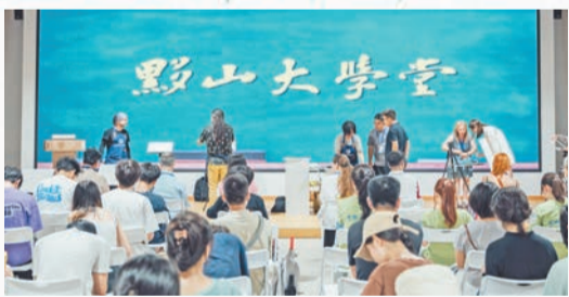
今年5月，黟縣推出研學寫生殿堂——「黟山大學堂」。