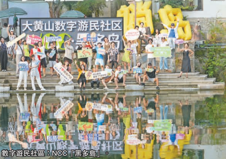
數字遊民社區：NCC「黑多島」。