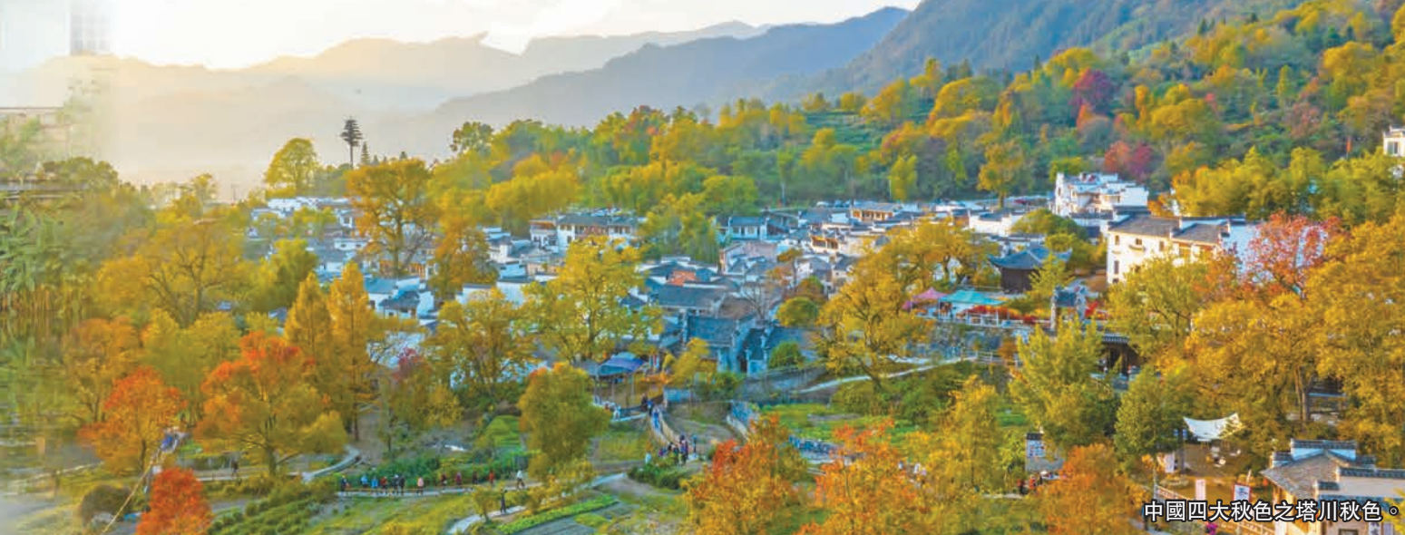
中國四大秋色之塔川秋色。