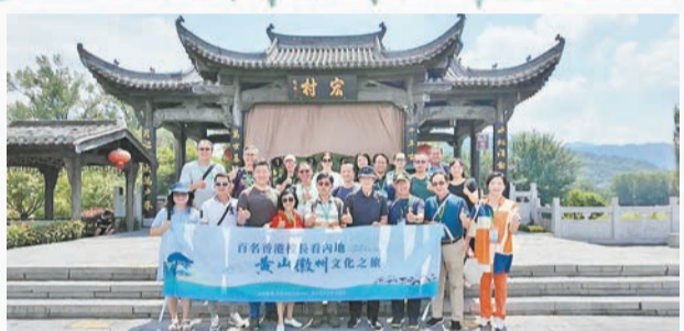
7月23日，2024年「百名香港校長看內地」——黃山徽州文化之旅到黟縣開展文化交流與考察活動。