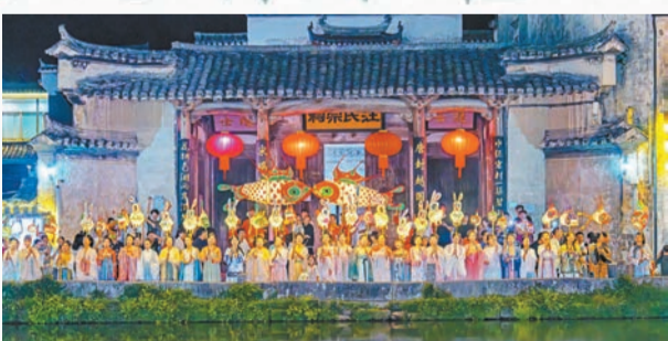
中秋奇妙夜，宏村花燈邀明月。