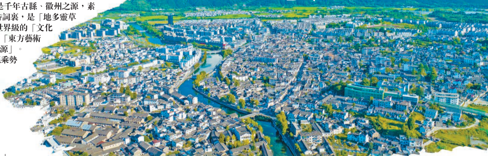
宜居宜業宜遊的千年古縣——黟縣。