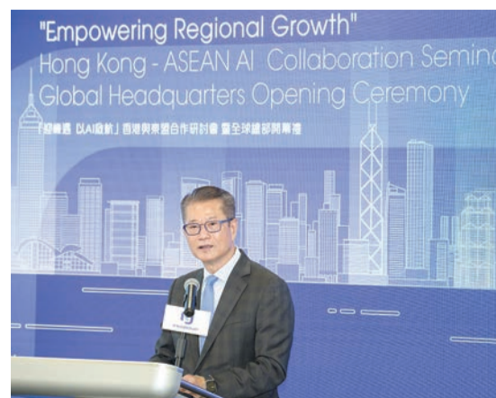
陳茂波表示，很多公司認同港獨特優勢，視港為東盟及其他地區拓展業務的理想基地。

陳茂波強調，這次研討會標誌香港與東盟之間的夥伴關係日益緊密，對雙方的共同繁榮和共同未來至關重要。他續說，AI的關鍵在於演算法、超級運算能力、數據和應用場景，這些都是香港得天獨厚的條件。他又稱，本港是內地和國際數據的匯聚點，正在投資所需的基礎設施，興建中的超算中心預計今年稍後開始運作。香港和大灣區共同為AI解決方案提供