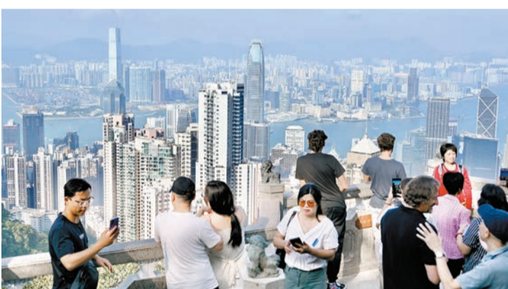
政府發言人表示，世銀的報告再度肯定香港作為國際貿易中心的地位。

發言人補充說：「然而，《報告》未有充分考慮一些香港營商環境便利的要素，例如實施普通法、法治優良、保障性別平等。政府會繼續與世銀保持密切