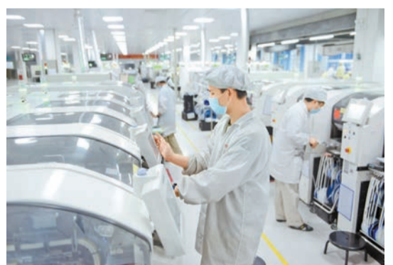
西可通訊是落戶河源國家高新區的第一家電子信息企業。