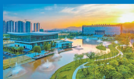
河源國家高新區中央活力區。

河源國家高新區的創新底蘊自不待言，更難能可貴的是其持續的創新能力和不斷精進的創新韌勁，為產業升級和發展新質生產力提供了源頭支撐。眾所周知，當前區域競爭越來越轉向產業競爭、新質生產力的競爭，從規模效應轉向對質量、效率的比拼。因此，河源國家高新區對於粵東西北地區能級的提升、產業的升級，乃至全省的高質量發展，都是一抹重要的亮光。全力「拚經濟」的當下，需要更多這樣的「優勢地區」展示擔當、脫穎而出。