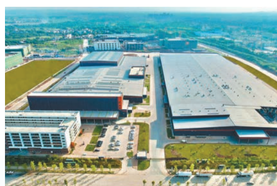
今麥郎（河源）有限公司廠房。