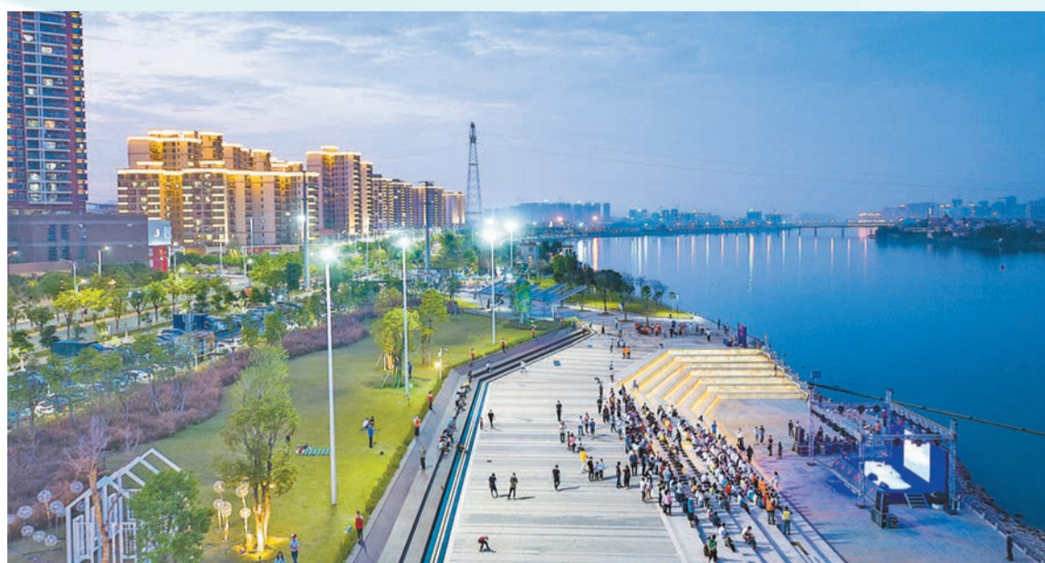
集生態、休閒、娛樂於一體的河源國家高新區濱水公園。

近年來，國家高新區發揮高質量發展先行示範作用，成為經濟發展的重要引擎，一批高科技產業集群培育壯大，成為推進新型工業化發展、保障產業鏈供應安全的中堅力量。致廣大而盡精微，今年以來，河源國家高新區認真貫徹落實廣東省委「1310」具體部署及河源市委「138」具體安排，堅持以實體經濟為本、製造業當家，深入實施「四個年」活動，縱深推進「八大攻堅戰」，推動園區又快又穩高質量發展，並在2023年度廣東省製造業高質量發展綜合考核中獲優秀等次，位居粵北地區之首；成功創建省級水飲料及食品特色產業園。余麗齡 戴一聞 劉夢莎