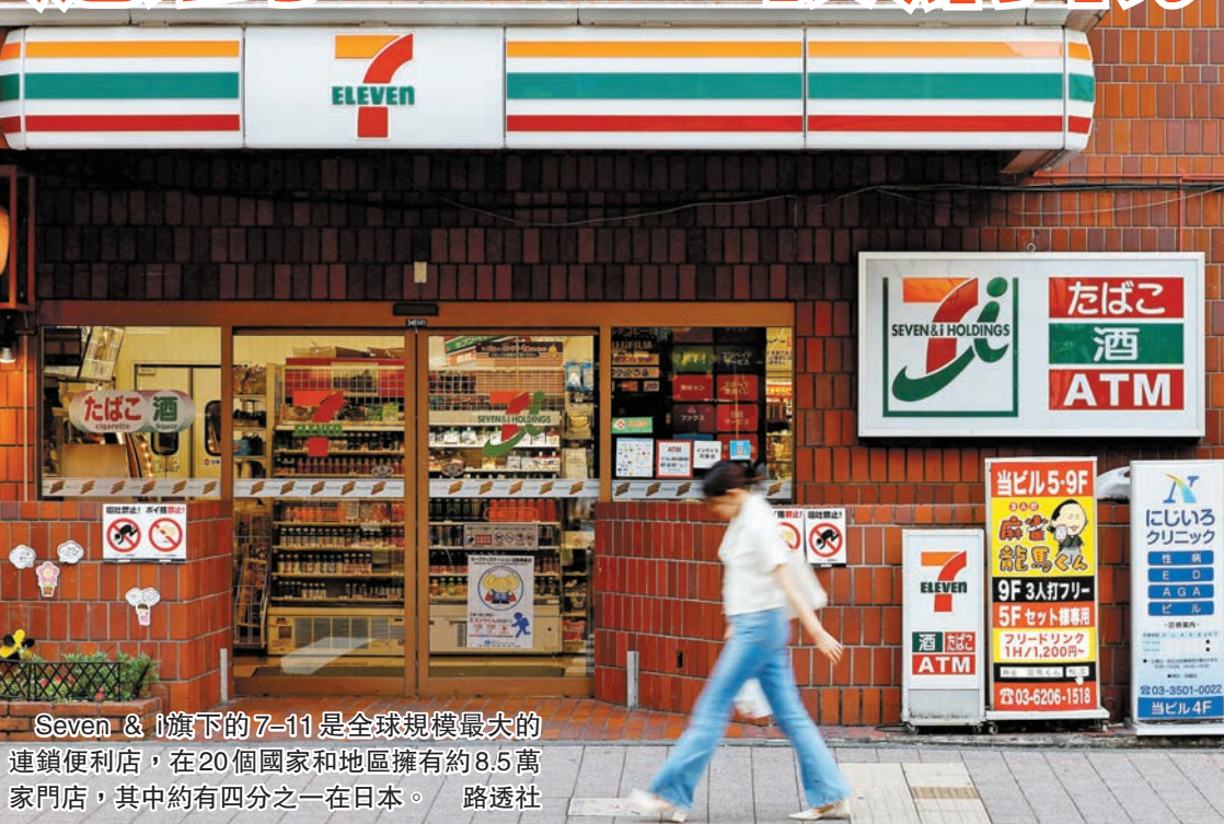
Seven & i旗下的7-11是全球規模最大的連鎖便利店，在20個國家和地區擁有約8.5萬家門店，其中約有四分之一在日本。