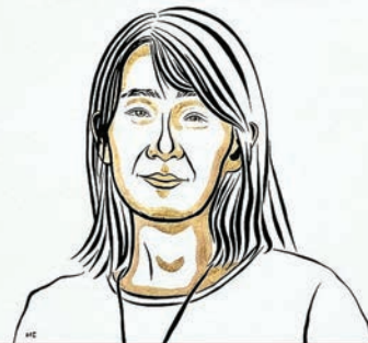
韓江將獲得1100萬瑞典克朗(約824萬港元)的獎金。諾貝爾獎網站