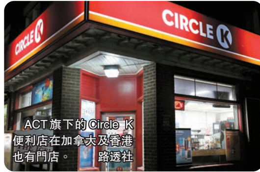
ACT旗下的Circle K便利店在加拿大及香港也有門店。

和地區擁有約1.7萬家門店，其中一半以上位於北美。ACT旗下有連鎖便利店品牌Couche-Tard、OK，另外還在歐洲經營Ingo加油站業務。