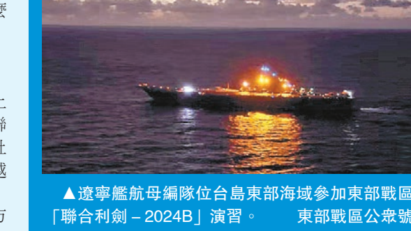
遼寧艦航母編隊位台島東部海域參加東部戰區「聯合利劍-2024B」演習。