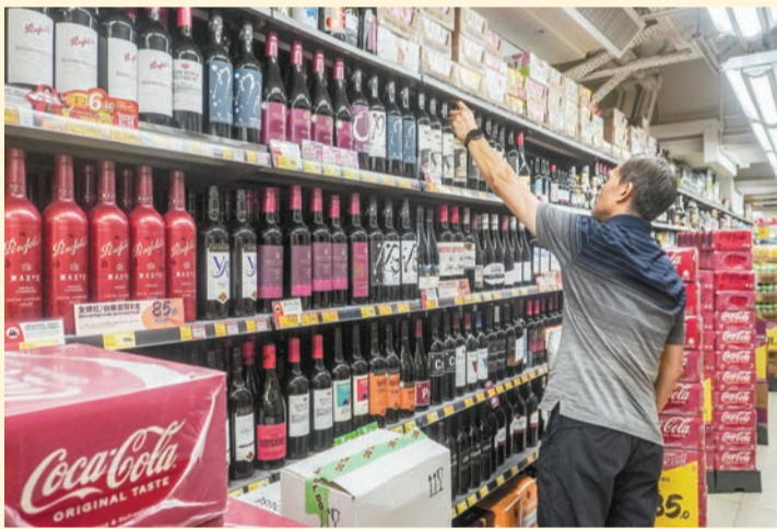
即日起，進口價200元以上的烈酒，200元以上部分的稅率由100%大幅減至10%。

據2007年、即尚未取消葡萄酒稅時，和2023年的數據，葡萄酒進口貨值的增幅約3.75倍，而其進口量的增幅則只有約33%，可見降低稅率後有助高價的葡萄酒貿易和相關的高增值產業發展，例如拍賣。另外，在2008年取消葡萄酒稅後，人均葡萄酒消耗量曾一度上升，但隨後持續下跌，並曾出現負增長，到2023年人均葡萄酒飲用量已回落至取消葡萄酒稅前的水平。