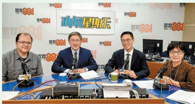
卓永興（左二）及楊潤雄（右二）出席電台節目，闡述香港旅遊發展方向。

此外，海洋公園大熊貓「盈盈」誕下龍鳳胎，加上兩隻大熊貓從內地來港，本港掀起大熊貓熱潮。楊潤雄表示，正與知識產權機構商討利用現時社會對大熊貓的熱潮，帶動本港經濟。他指出，當社會很多人很關注和被大熊貓吸引的時候，會出現很多商機。政府正在為兩隻新來的大熊貓命名比賽、繪畫比賽，希望更多人注視和重視。