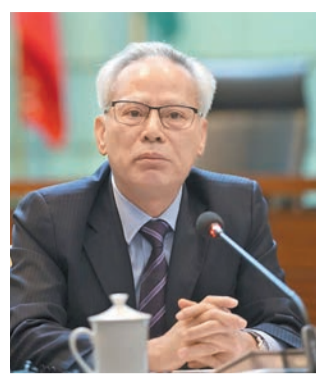
澳門終審法院確認岑浩輝為行政長官候任人。

【香港商報訊】記者戴合聲報道：澳門特別行政區公報昨日刊登終審法院有關澳門特別行政區第六任行政長官選舉結果的公告，確認選舉的總核算結果，並宣布岑浩輝當選為澳門特區第六任行政長官候任人。