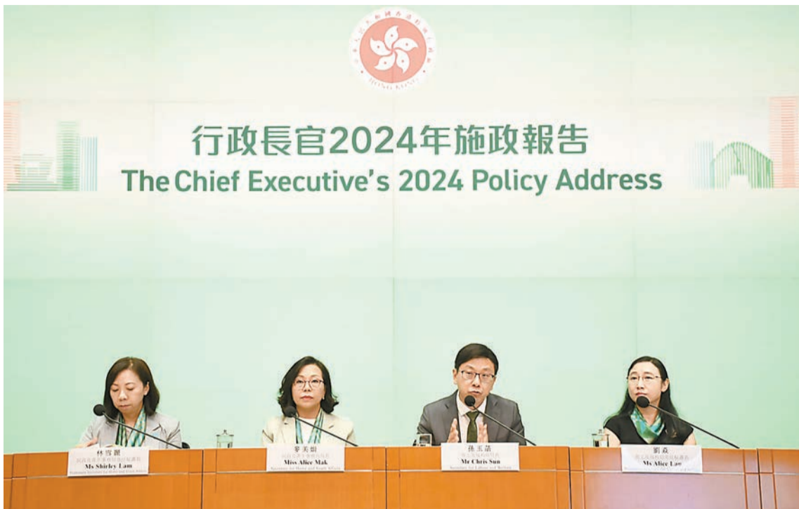
麥美娟（左二）、孫玉菡（右二）出席施政報告相關措施記者會。

在支援照顧者方面，會研究建立護老者和殘疾人士照顧者資料庫，他強調，在使用大數據時要確保符合香港私隱條例。現在每4個長者便有3位從社署領取不同現金資助，同時有關愛隊上門資料、醫療服務資料，如果有辦法將幾個數據庫連結，便可提早知道問題、通知相關社福機構早點探訪有關家庭，有利提前介入。在增強殘疾人士照顧方面，朋輩支援過往只是在精神復原人士中心有這工作崗位，因其成效相當好，會在殘疾人士中心增設90個朋輩支援職位。