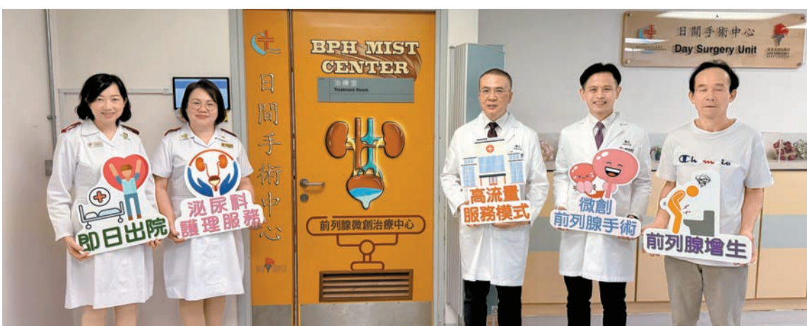
大埔那打素醫院提供前列腺增生微創手術，病人的輪候時間由12個月縮短至4個月。

【香港商報訊】記者唐信恒報道：前列腺增生是男性常見疾病，症狀為排尿困難、頻尿等。據衛生署數據顯示，70歲以上男性約四分之三會有前列腺增生，80歲以上男性幾乎90%都會患病。現時有藥物療法和傳統手術進行治療，惟均有不同副作用。大埔那打素醫院在2022年分階段試行高流量手術服務模式，並引進微創手術，令病人的輪候時間由12個月縮短至4個月。