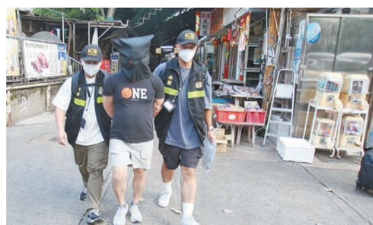
海關拘一名涉案男子，檢獲675萬元私煙。

【香港商報訊】記者區天海報道：海關人員昨日下午在牛池灣一帶展開反私煙巡查行動時，搗破一個私煙儲存倉庫，當場拘捕一人，起獲市值675萬元私煙。關員昨日展開巡查行動期間，在牛池灣發現一名男子推着手推車形迹可疑，於是上前截停，搜查其背囊及紙箱，檢獲約1萬支未完稅香煙，當場將該名54歲男子拘捕，他報稱是廚房工人。其後，關員押解疑犯到牛池灣村其租用的鐵皮屋搜查，再檢獲約150萬支私煙，估計單位用作儲存及分銷中心，檢獲的私煙市值約675萬元，應課稅值495萬元。海關正在調查私煙的來源，估計是供應九龍東一帶。