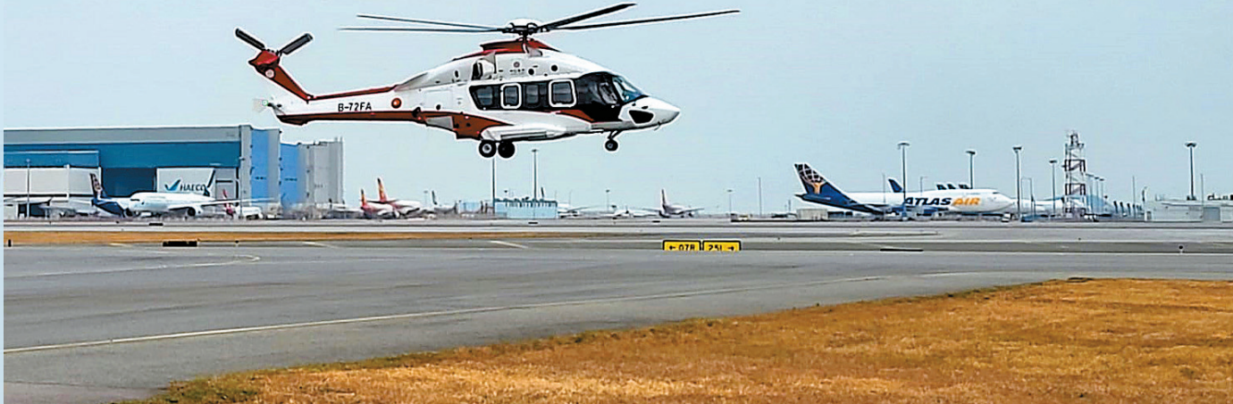
昨日有直升機服務營運商進行了低空飛行跨境航線試飛，由深圳飛抵香港國際機場。

【香港商報訊】記者馮仁樂報導：特區政府致力推動發展低空經濟，陸續有相關營運商試行。財政司副司長黃偉倫稱，昨早再有直升機服務營運商進行了低空飛行跨境航線試飛，由深圳南頭直升機場經深圳蛇口郵輪中心飛抵香港國際機場，只需15分鐘。