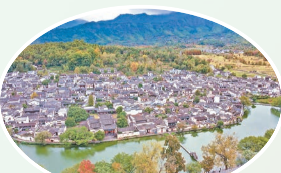
圖為11月6日拍攝之宏村。

「總書記的重要講話，令我們備受鼓舞，倍增幹勁。讓我們的工作思路更加清晰、信心更加充