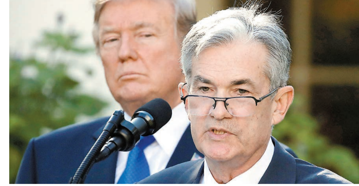
特朗普經常公開批評鮑威爾(右)，被指為干預聯儲局的獨立性。 資料圖片

【香港商報訊】美國聯儲局於當地時間7日14:00(本港時間8日凌晨3時)公布結果，雖然市場幾乎肯定會減息0.25厘；不過，在特朗普當選美國總統後，市場開始關注他如何影響美國經濟前景，以及聯儲局會否傳遞出12月繼續減息的信號。有分析指出，特朗普的關稅和財政政策可能令美國通脹持續，並因而令聯儲局明年放慢減息步伐，甚至已經有大行即時調整對未來減息路向的預測。