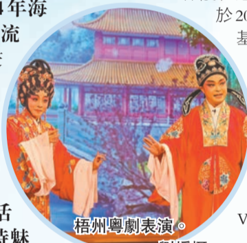
梧州粵劇表演。

嶺南風情，沉浸式體驗。梧州騎樓城建築群始建於19世紀末，擁有百年歷史，現存街道22條，樓宇560幢，規模、數量、集中程度和保存完整度在國內均屬罕見，被譽為「中國騎樓博物城」。為進一步保護和挖掘騎樓城的歷史文化價值，梧州市於2023年實施騎樓城城市更新——旅遊基礎設施綜合提升項目，對騎樓城片區進行修繕保護和基礎設施提升。