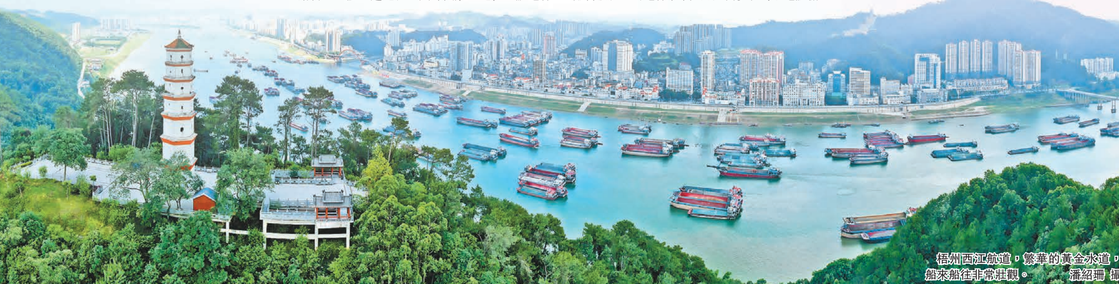
梧州西江航運繁華的黃金水道，船來船往非常壯觀。