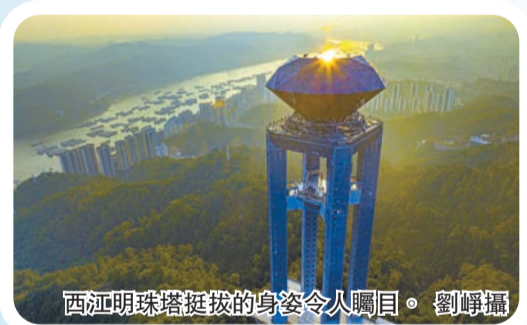
西江明珠塔挺拔的身姿令人矚目。