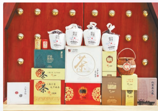
各種精美包裝的六堡茶。

梧州，這座嶺南古郡正以嶄新的面貌和獨特的魅力迎接着來自四面八方的遊客。無論是深厚的文化底蘊、豐富的旅遊資源還是蓬勃發展的工業旅遊項目，梧州都以其獨特的魅力，成為了華南地區乃至全國的重要旅遊目的地。在未來的發展中，梧州將繼續秉承「以文塑旅、以旅彰文」的發展理念，不斷推動文旅產業的融合發展，為遊客帶來更加豐富多彩的旅遊體驗。