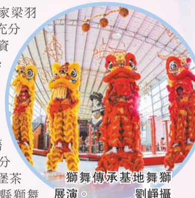
獅舞傳承基地舞獅表演。

非遺瑰寶，古郡梧州歷史底蘊深厚。梧州非遺資源十分豐富，除了六堡茶製作技藝、藤縣獅舞和梧州粵劇同樣尤為突出。藤縣獅舞以其精湛技藝和獨特風格享譽國內外，多次在大賽中獲獎；梧州粵劇則通過持續不斷的演出與展示，傳承着嶺南文化的獨特韻味。梧州通過「非遺+」發展模式，推動非遺與旅遊、教育、科技等領域的深度融合，為非遺文化注入了新的活力。