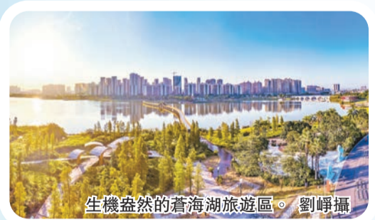
生機盎然的蒼海湖旅遊區。