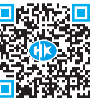
掃碼睇許正宇專訪片段