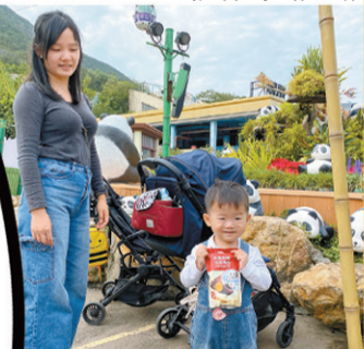
▼葉生夫婦每年都來海洋公園看大熊貓。