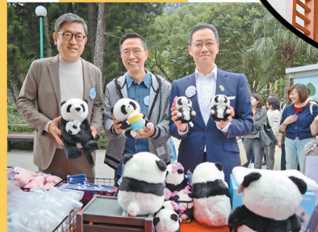
▲海洋公園特別安排在威威劇場實時直播一對龍鳳胎的生活情況。

據香港海洋公園介紹，龍鳳胎熊貓正在「暴風式」成長，兩隻寶寶均已長出牙齒，出生時重122克的姐姐體重已增至5.3公斤，而細佬的體重由出生時的112克增至5.5公斤。