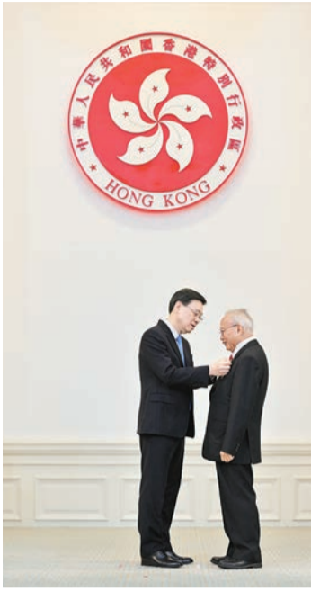
李家超將大紫荊勳章頒授予劉兆佳(右)。政府新聞處圖片