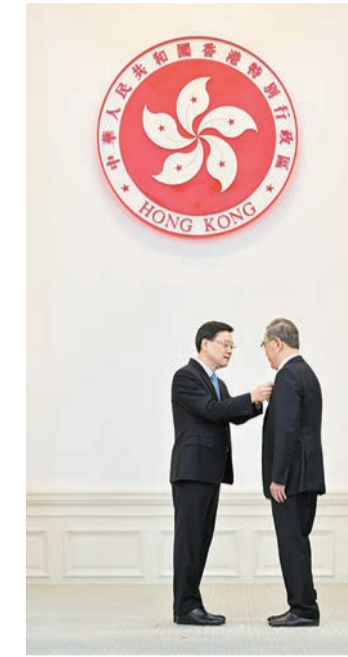
李家超將大紫荊勳章頒授予林樹哲(右)。

【香港商報訊】記者馮仁樂報道：2024年度授勳典禮昨日在香港禮賓府宴會廳舉行，多位作出重大貢獻、惠及香港社會各個領域和界別的人士獲頒勳章及嘉獎。行政長官李家超昨日在社交平台表示，祝賀所有得獎人士，希望他們繼續在其範疇盡展所長、服務社會。