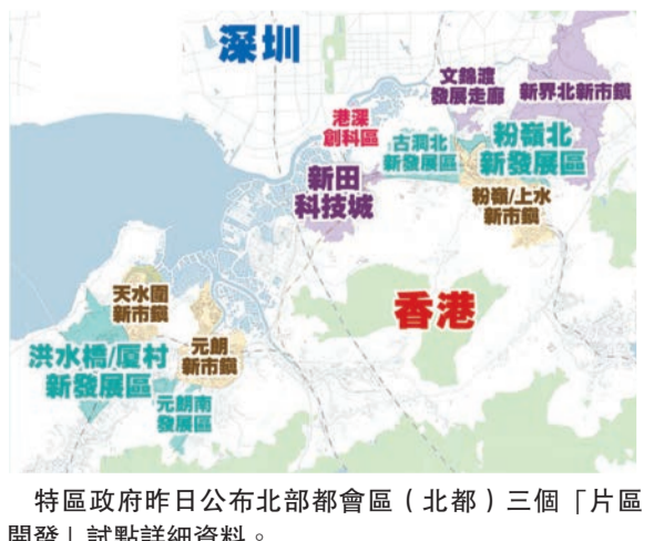
特區政府昨日公布北部都會區(北都)三個「片區開發」試點詳細資料。

規劃、發展要求及其他相關條件的意見；發展商是否願意就三幅創科用地的發展增加參與程度，是否願意根據政府的創科產業規劃與政府合組公司共同出資興建、批租和管理創科園區，等等。