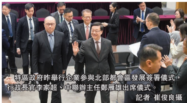
特區政府昨舉行企業參與北部都會區發展簽署儀式，行政長官李家超、中聯辦主任鄭雁雄出席儀式。