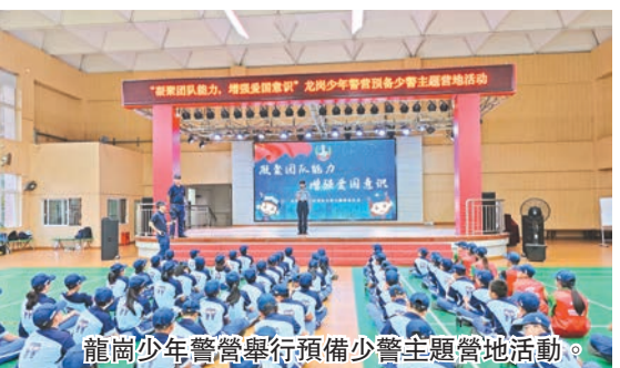
龍崗少年警營舉行預備少警主題營地活動。