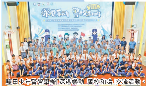
鹽田少年警營舉辦「深港樂動 警校和鳴」交流活動。

深圳少年警營將持續開展多主題、多形式的警營活動，讓少警們感受警察文化，將「自強、自律、自信、愛國、服務、擔當」的少警精神內化於心，外化於行，用實際行動展現新時代少年風采。同時，也將進一步密切與香港少年警訊等制服團體的聯繫，為兩地青少年的溝通交流創造更多機會，攜手同心向未來。