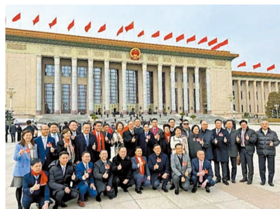
兩會結束之後全體港區人大代表在北京人民大會堂前合影。