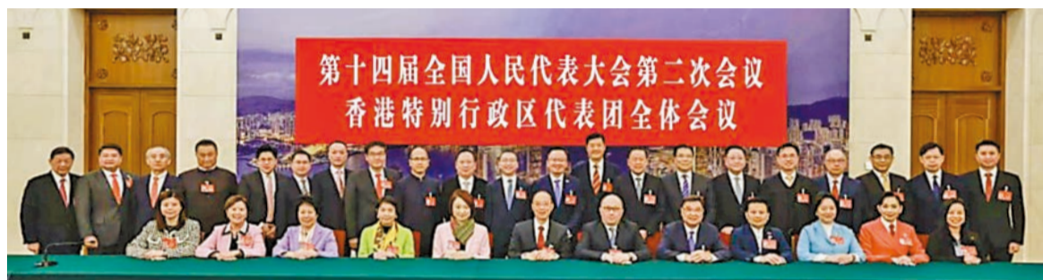
第十四屆全國人民代表大會港區人大代表在北京人民大會堂香港廳舉行全體會議。