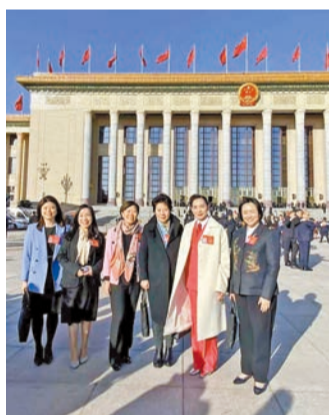
會前港區人大女代表在北京人民大會堂前合影。

南海航空貨運(香港)有限公司是一家專營全球海、陸、空運及物流管理業務的國際貨運企業。母公司「株式會社南海EXPRESS」設立於日本大阪，在國際貨運業中聲名遠播。不同與人們最常見到的快遞行業，國際物流的主要業務是大宗貨物的運輸。徐董事長扎根物流行業多年，是真正從各種困難中打拚出來的佼佼者，面對風雲變化的國際形勢、時代的變化，她處變而不驚，不斷革新管理理念和技術。