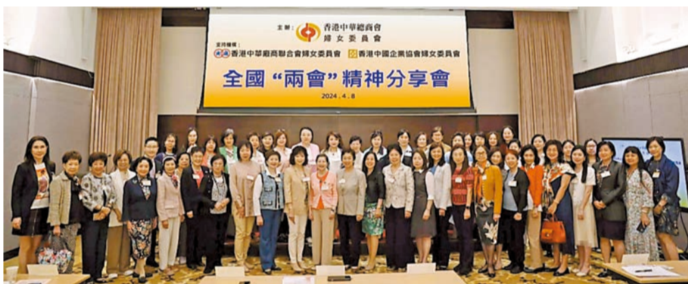
出席中華總商會婦女委員會主辦的全國兩會精神分享會並作為主講嘉賓發言，會後全體合影留念。