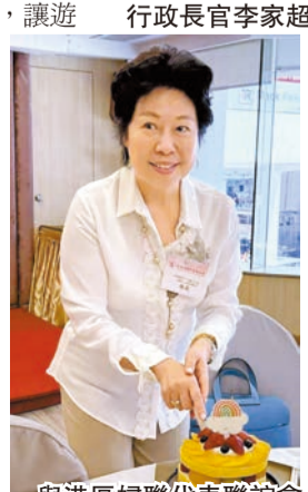
與港區婦聯代表聯誼會的姐妹們一起慶祝生日。