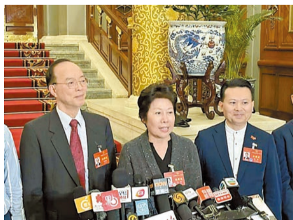
兩會期間作為港區人大代表接受媒體採訪。