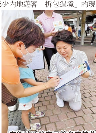
在街站呼籲市民簽名支持落實《基本法》23條。