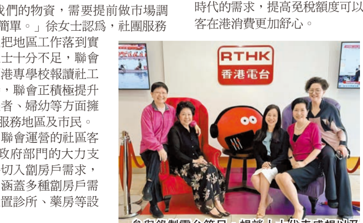
參與錄製電台節目，暢談人大代表感想以及婦女精神。