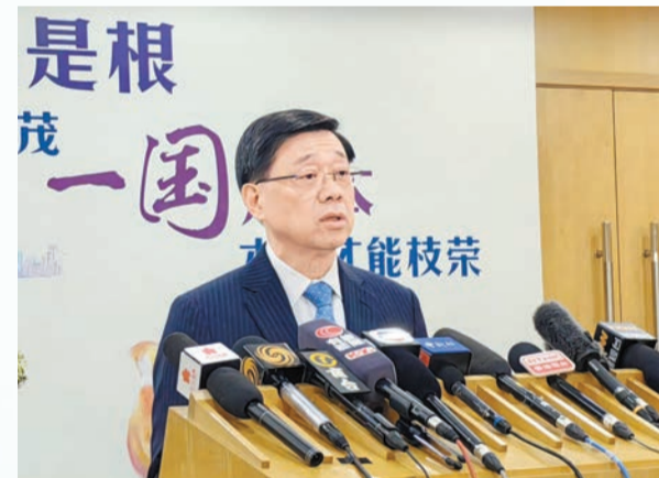
行政長官李家超昨晚在京會見傳媒。

【香港商報訊】記者張麗娟北京報道：昨晚，正在北京述職的行政長官李家超在京會見傳媒時表示，當天述職期間向國家主席習近平匯報了多方面重點工作，衷心感謝習主席對他本人和特區政府的工作充分肯定和堅定支持。習主席表示，二十屆三中全會強調要發揮「一國