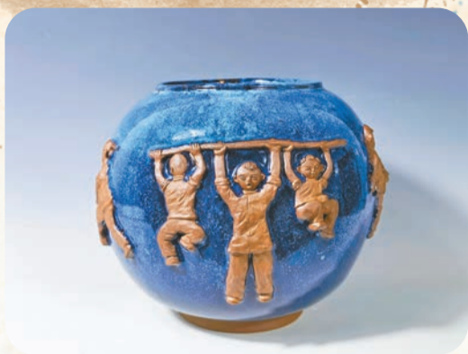
丹鈞泥塑《童趣 舉重》