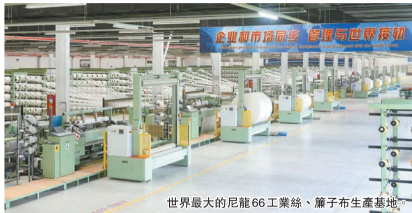
世界最大的尼龍66工業絲、簾子布生產基地。

產業變革、貿易壁壘、消費升級、要素成本上升、經濟復蘇乏力……面對外部形勢愈發嚴峻，國內市場內捲嚴重的「雙端擠壓」，2024年，神馬股份把深化內部改革作為適應新發展形勢的第一動力，以提高核心競爭力對沖外部壓力，心無旁騖攻主業，凝心聚力謀發展，在深化改革、質量提升、項目建設、資本運作等方面努力向內生長，積極向外綻放，正朝着高端化、精細化、品質化、綠色化和國際化的方向穩步邁進。