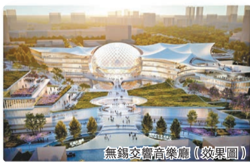
無錫交響音樂廳（效果图）