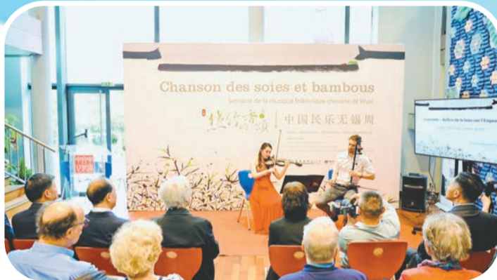
「絲竹的香頰」開幕式

在推廣中樂的過程中，無錫注重創新與國際化，以開放姿態積極參與國際音樂交流。無錫音樂之都促進中心負責人介紹，今年，除了費城交響樂團與無錫交響樂團合作奏響跨越民族和時代的經典樂章，無錫國際音樂家駐地計劃吸引了來自葡萄牙、意大利等地的音樂家，與本地團隊合作激發創作靈感。無錫還通過參與國際戲劇節、舉辦跨文化音樂活動等形式，逐步實現從「地方音樂中心」到「世界音樂城市」的轉變。