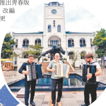
無錫啟動國際音樂家駐地計劃