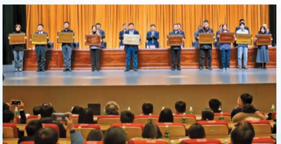
鐵西區科技大會表彰現場。

以創新為引擎，鐵西的「新」產業正提質增速。2024年，戰略性新興產業產值增長達13.5%，佔規模以上工業產值比重突破35%。生物醫藥產業產值保持兩位數增長，三生製藥成為生物醫藥細分領域國內第一，德生生物建成國內首個全國產化CD-MO平台。新一代信息技術產業主營業務收入增長22%。北方大數據交易中心完成首單數據產品掛牌交易。新能源產業產值增長20%，微控磁懸浮應用產業基地等38個項目加快建設。新材料及集成電路產業規模以上企業達到128家，產值突破300億元，漢京半導體陶瓷材料填補國內空白。