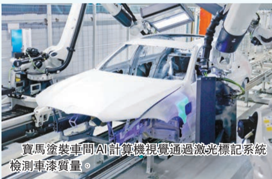
寶馬塗裝車間AI計算機視覺通過激光標記系統檢測車漆質量。