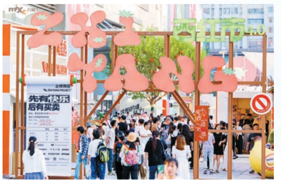
西紅市4.0市集：集合創意品牌、打卡遊樂、新潮飲食的新中式街區。