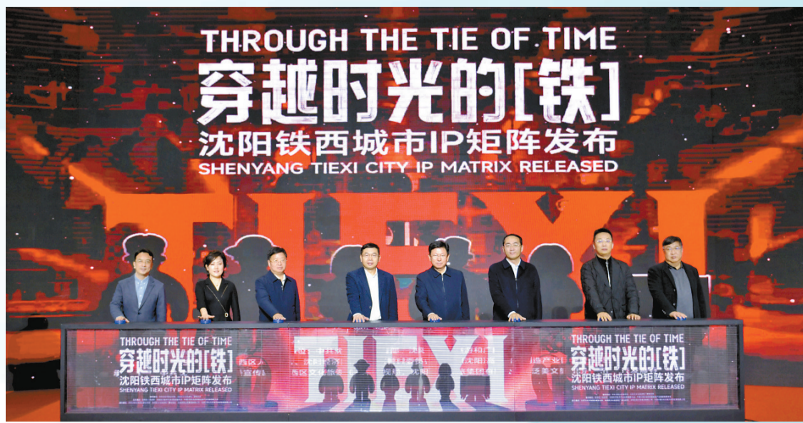
鐵西城市IP矩陣發布。