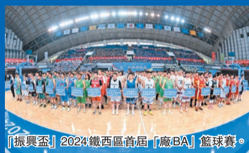
「振興盃」2024鐵西區首屆「廠BA」籃球賽。

以工業立區是鐵西推動高質量發展的重要戰略，工業文化也構成了鐵西區獨特而富有魅力的「城市名片」。特別是近年來，為進一步放大「歷史文化、紅色文化、工業文化」優勢，用好「六地」資源，鐵西區始終堅持用文化點亮歷史，照耀未來。因此，帶有東北個性與氣質的鐵西城市IP「老鐵家」應運而生——全國首個區（縣）獨立設計並發布的城市IP矩陣日前在鐵西重慶路推出。「依託鐵西特色工業文化資源，通過對城市精神、城市意象、城市內容的挖掘提煉，推出鐵西城市IP矩陣，意在提高瀋陽知名度和工業文化品牌影響力，塑造一個具有影響力和辨識度的「新鐵西」形象。」鐵西區相關負責人介紹。