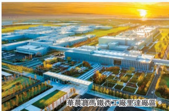
華晨寶馬鐵西工廠里達廠區。