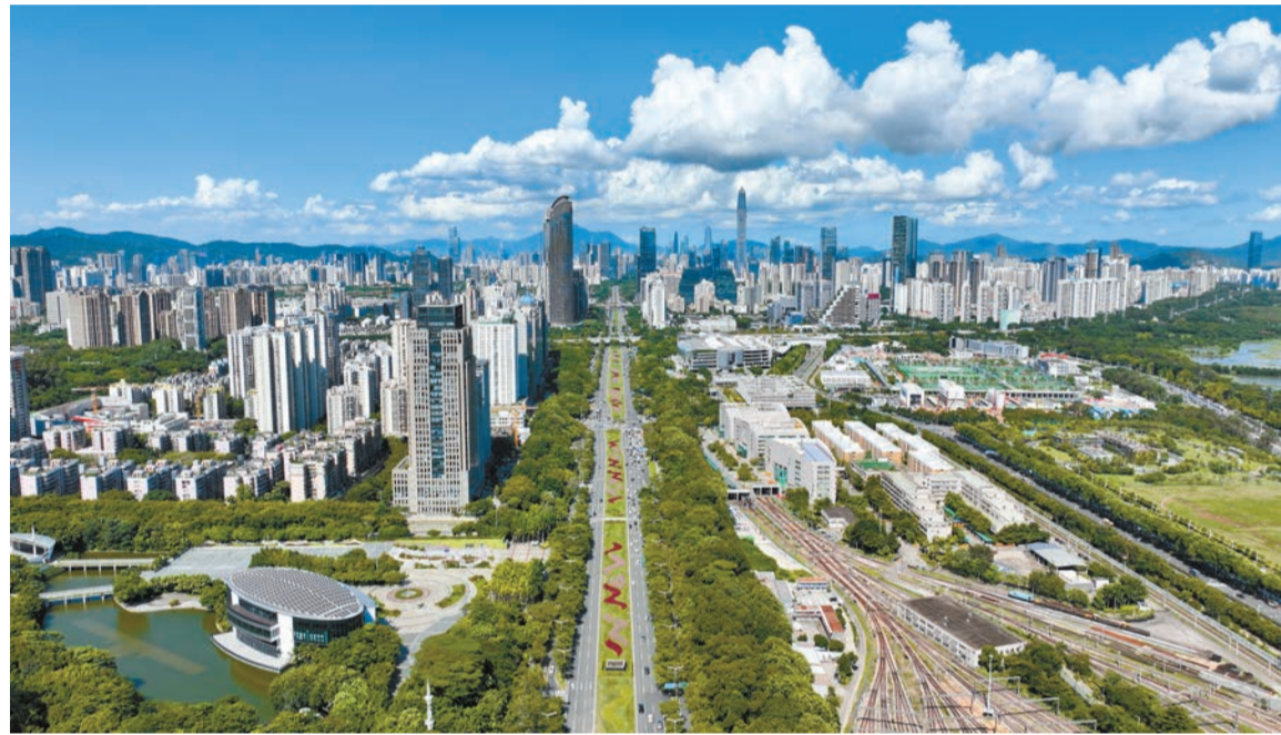
2024年，深圳房地產市場經歷了一場顯著的回暖之旅。 中新社

2024年，深圳房地產市場的回暖離不開政策的持續助力。 據統計，2024年，深圳樓市的相關調控政策總共出台了16次，圍繞「穩樓市」的目標，打出了包括降首付、鬆綁限購、降稅費、降利率、存量房收儲、以舊換新、城中村改造、控土地供應等在內的組合拳。這些政策不僅降低了購房門檻，加快了審批流程，還釋放了大量的剛需和改善型需求，為市場注入了新的活力。 特別是5月6日，深圳市住房和建設局發布《關於進一步優化房地產政策的通知》，9月29日，深圳市住房和建設局網站發布《關於進一步優化房地產市場平穩健康發展政策的通知》，深圳樓市迎來了強力支持政策。 這些政策為深圳樓市成交量的釋放提供了巨大動