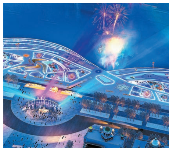
哈爾濱松花江冰雪嘉年華。

【香港商報訊】記者張曉霖報道：近日，記者從2025第七屆哈爾濱松花江冰雪嘉年華開幕式上獲悉，由黑龍江哈爾濱文化旅游規劃設計院有限公司打造的第七屆哈爾濱松花江冰雪嘉年華正式開園，並以冰上面積爲413061.97平方米，榮獲「最大的戶外冰上樂園」吉尼斯世界紀錄稱號。