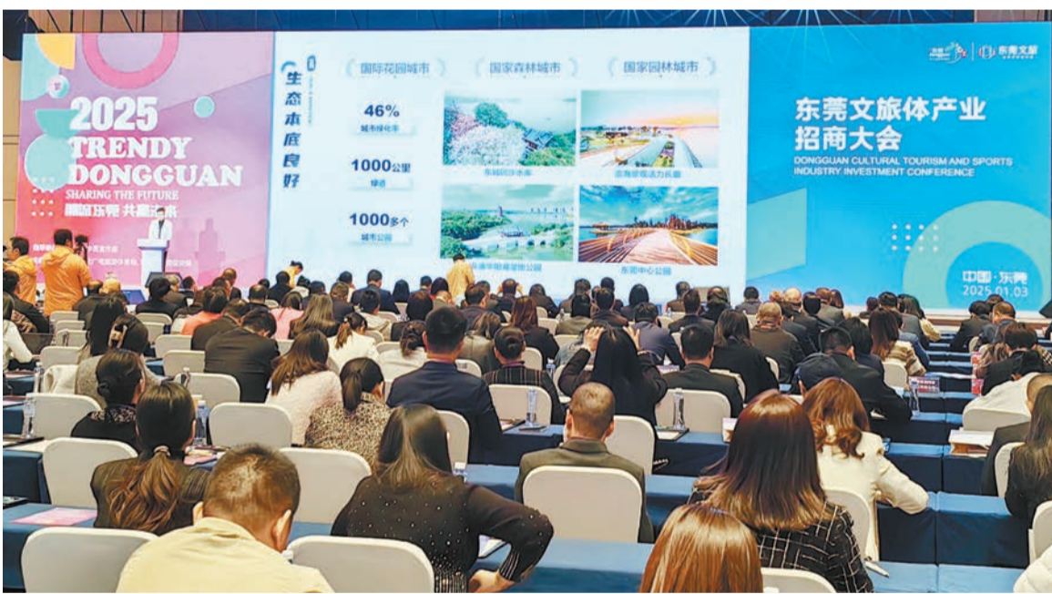
東莞文旅體產業招商大會現場。

本次招商大會現場，東莞市投促局、文廣旅體局分別介紹了東莞文旅體產業的廣闊前景以及政策扶