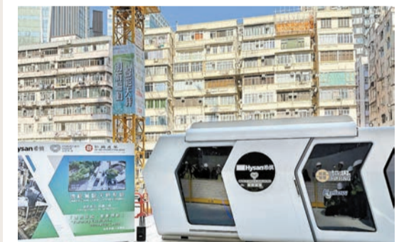
遠程駕駛天秤系統可在地面的控制艙內工作，改善操控環境，有望吸引更多年輕人入行。

【香港商報訊】記者姚一鶴報道：希慎興業（014）及華懋在2021年5月以197.8億元奪得的銅鑼灣加路連山道商業項目近期正式命名為利園八期，引入「機電裝備合成法」MiMEP等建築科技，進一步邁向可持續發展的願景。項目更特別引入了「遠程駕駛天秤系統」，該系統結合組裝合成（MiC）、人工智慧（AI）和物聯網（IoT）技術，不僅提升工地安全，更為業界改善工作環境，吸納更多人才入行。利園八期預計於2026年第二季竣工。