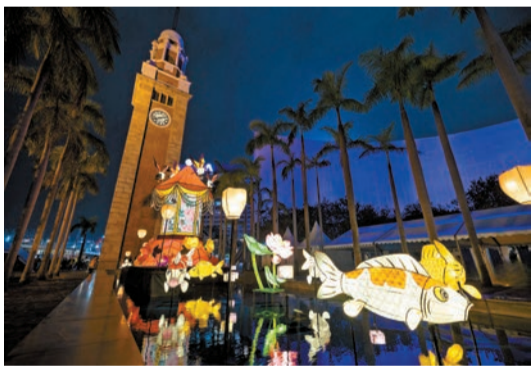
香港文化中心露天廣場舉行春節綵燈展《華燈·傳承》。

【香港商報訊】康文署由昨日起至2月16日在香港文化中心露天廣場設有春節綵燈展《華燈·傳承》，與市民一起迎接蛇年的來臨。亮燈時間為每日下午6時至晚上11時。 露天廣場的水池上豎立着一盞約6米高的大型宮燈，綴以牡丹和喜鵲，宮燈四圍亦擺設天燈、鯉魚和荷花造型的綵燈，充滿節慶的歡樂氣氛。