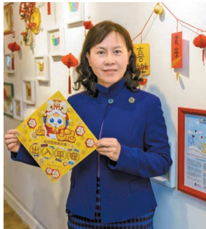
運輸及物流局長陳美寶昨日與傳媒聚會，談及未來交通發展大計，她形容「路通才能財通」，會注重「慳家」節省成本。

【香港商報訊】記者馮仁樂報導：年終歲晚，運輸及物流局長陳美寶昨日與傳媒聚會時表示，交通運輸基建對經濟發展、市民生活極之重要，形容「路通才能財通」，香港交通基建投資不會停，但要更加注重成本「慳家」，「慳一蚊是一蚊」。同時，要引入新思維，更加重視市場力量，引入新科技，吸納業界創意，突破傳統框框，增加競爭力，增加解決方案選擇。