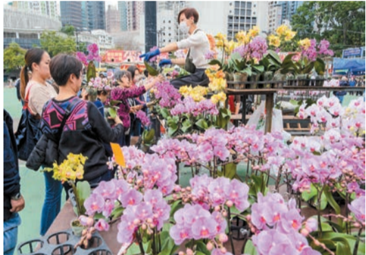
香港維多利亞公園年宵花市昨日開鑼，吸引大批市民入場選購年花。

【香港商報訊】昨日起，全港15個年宵市場開鑼一連七日舉行，將開放至大年初一早上7時。其中，在最大規模的維園年宵市場，總共設有391個乾濕貨攤位及4個快餐攤位，不少檔主早上陸續開檔，也有不少市民到場及購買年花。 有乾貨攤位因應大熊貓熱潮，售賣以熊貓為主題的商品，亦有老師帶領學生，趁蛇年將至，售賣自家設計的「蛇餅玩偶」。花檔方面，有擺檔20年的檔主表示，生意主要靠熟客光顧，對整體人流和銷情保持樂觀。有購買年花的市民表示，已購買喜愛的花卉，又說價錢與去年大致相若。