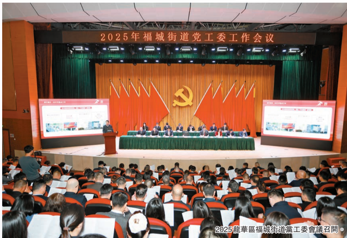
2025龍華區福城街道黨工委會議召開。

創新要素加快聚集。全省首家「可持續燈塔工廠」花落福城，中科精工、海目星等4家企業獲評大灣區戰略性新興產業領航企業；氫藍時代榮登首屆粵港澳大灣區新能創力量榜；美團無人機項目獲粵港澳大灣區投資明星項目獎；全年認定「龍舞