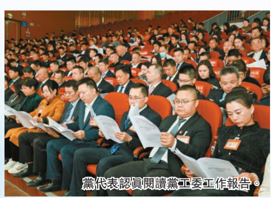
黨代表認真閱讀黨工委工作報告。

精神文明更加富足。福城街道綜合性文化服務中心獲評「廣東省特級文化站」；青工原創舞蹈成為全市唯一入選的全省推廣節目；精品文藝作品在市級以上比賽中斬獲4金3銀6銅，金獎數、獲獎數全區「雙第一」。大力弘揚社會主義核心價值觀，1人獲「廣東好人」榮譽稱號。