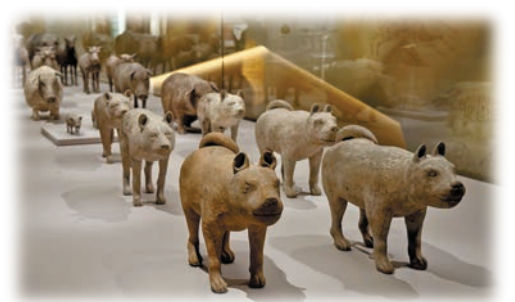
漢陽陵出土了大量的動物陶俑，以「六畜」——馬、牛、羊、狗、豬和雞的數量最多，顯示西漢時期農耕及畜牧業的發展十分興旺。

為配合展覽，博物館開設了一系列互動體驗、講座與工作坊，包括秦始皇帝陵博物院、漢景帝陽陵博物院、陝西省考古研究院（陝西考古博物館）、香港中文大學和香港大學學者主講的4場講座，以及迷你陶泥秦俑製作等工作坊。