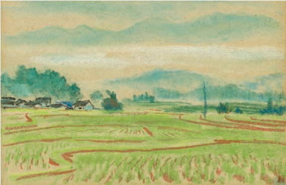
李樺作品《風景寫生集》之一。