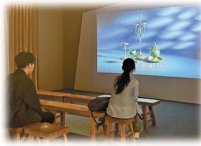
展覽運用多媒體技術，讓觀眾可通過電子螢幕互動，欣賞與製造秦漢特色瓦當，增強參與感。