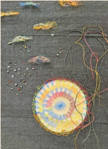
阿里·貝瓦吉裝置作品《編織海洋》，2024年。

日期：即日起至7月13日 時間：星期一、三至日上午11時至晚上7時； 逢星期二休館 地點：荃灣南豐紗廠二樓CHAT六廠 門票：免費入場 內容：現時越來越多傳統手工藝品發展成當代藝術品，兩者的界線越發模糊。「湧動的暗線」展覽通過將藝術品、手工藝品與文獻檔案並置展出，探討傳統民間工藝與當代藝術之間的協同關係。展品包括了手工編織與絲網印刷的中國織物、傳統印尼織物及中亞裝飾圖案等多樣化的民間工藝品，涵蓋內地、香港、韓國、日本、馬來西亞共13位亞洲藝術家之作。踏入南豐紗廠，首先可見印尼藝術家阿里·貝瓦吉的三層高裝置藝術品《編織海洋》，將峇里島海岸收集的塑膠繩拆解並紡成纖細彩線，賦予廢料新生命。藝術家並以相同材料創作手環，延續環保理念，也為觀眾提供了與作品互動的新方式。 記者：儀