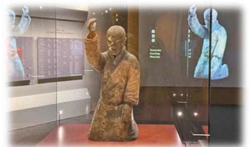
秦朝跽姿俑。古時直身而股不着腳跟為「跪」；跪而彎身挺腰為「跽」，此俑上身挺直，雙膝跪地，右臂微屈上舉，姿態和裝束明顯別於兵馬俑坑出土的秦俑。

漢承秦制，漢朝在繼承秦朝政治制度的基礎上，進行一系列的改革和發展，尤其是漢景帝時期，以良好的治理模式呈現「文景之治」的盛世，完成了對「大一統」政治理念的貫徹和充實，使中國政治制度更加完善和成熟。制度單元