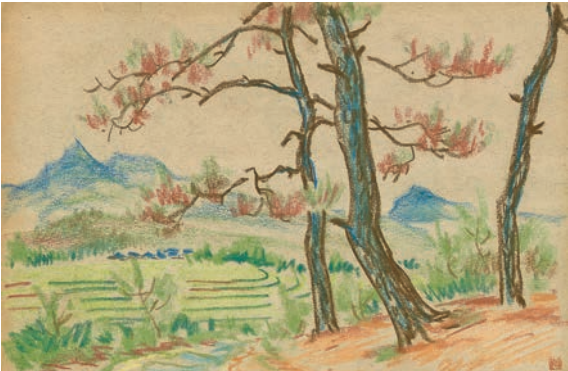
李樺作品《風景寫生集》之二。