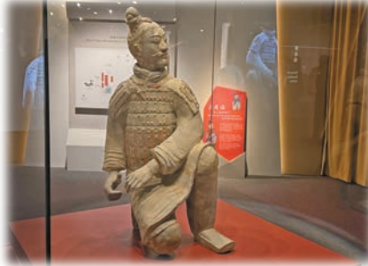
秦朝跪射俑，出土於秦始皇帝陵區二號兵馬俑坑，秦始皇帝陵博物院藏。