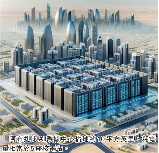
阿布扎比 AI 數據中心佔地約 10 平方英里，耗電量相當於 5 座核電站。

據科技媒體 bleepingcomputer 報道，OpenAI 計劃在 2026 年推出一款由 ChatGPT 驅動的新產品，旨在讓 AI 助手深度融入用戶生活的各個場景。根據披露的文件顯示，OpenAI 希望 ChatGPT 不僅通過現有應用提供服務，還能在日常生活、出行和辦公中發揮更廣泛的作用，例如回答問題、導航路線、記錄會議筆記等。文件還透露，OpenAI 可能正在開發一款原生集成 ChatGPT 的硬件設備，以實現隨時陪伴的 AI