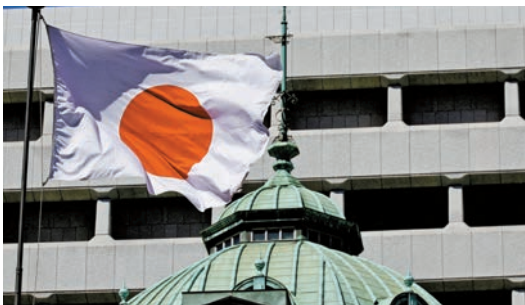
日本央行行長表示，會在適當時機再加息。 資料圖片

【香港商報訊】日本海外資產規模雖然創歷史新高至 533 萬億日圓（逾 29 萬億港元），但 34 年來首次失去全球最大債權國地位，被德國以 569.7 萬億日圓超越，而中國則以 516.3 萬億日圓排第三。