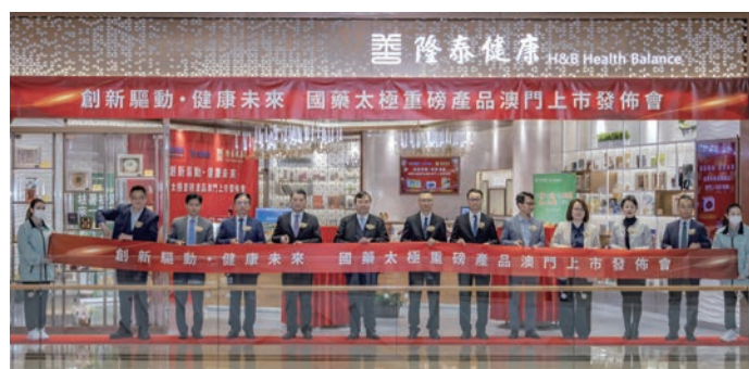
圖為國藥太極產品澳門上市發佈會

未來，美康行將繼續深化“中醫藥國際化”戰略，打造澳門品牌標杆，佈局“大健康+醫療科技”高增長賽道，強化供應鏈樞紐功能，拓展區域服務網路，借勢澳門“中葡平臺+橫琴政策”，避開紅海競爭。持續發展參與“一帶一路”和社會責任。