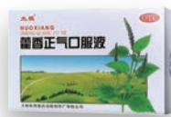
太極牌藿香正氣口服液

► 品牌賦能： 聯動國藥集團、華潤三九等祖國中醫藥行業龍頭企業，定制「包裝升級+文化融合」方案，並陸續獲澳門中成藥註冊批文，提升品牌國際競爭力。