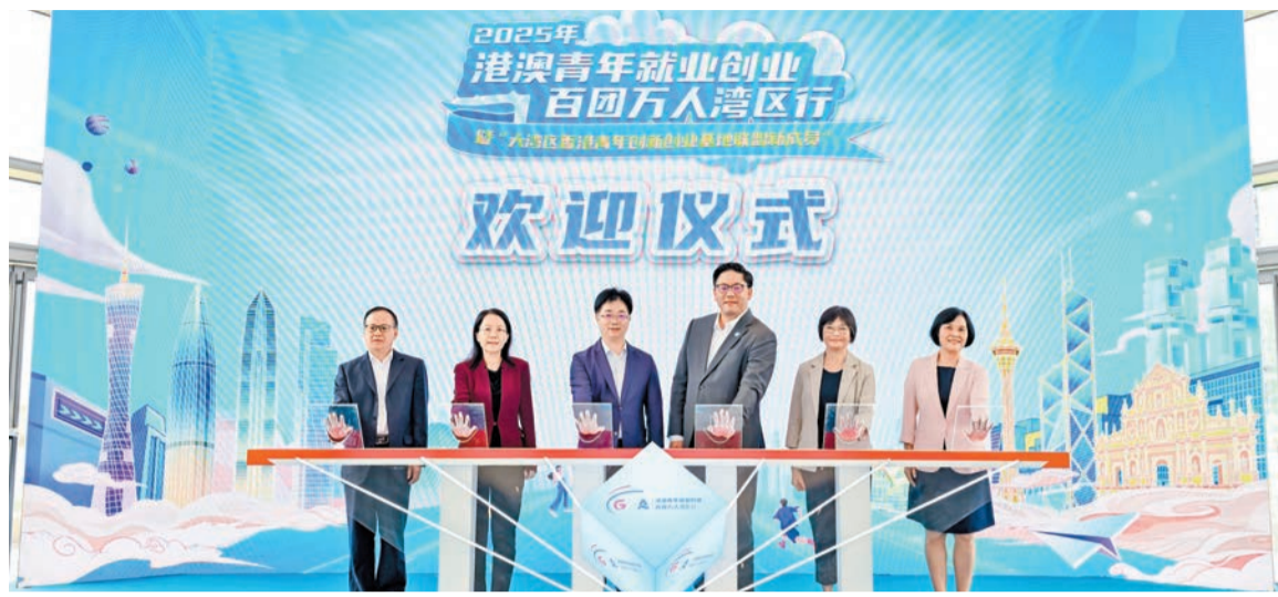
2025年港澳青年就業創業百團萬人灣區行啟動儀式現場。

本次歡迎儀式的另一大亮點是大灣區香港青年創新創業基地聯盟再添新成員。本次進入聯盟的共8家單位，單位類型包含2家高校、2家社會組織、4家創業孵化載體。活動現場，4個創業孵化載體代表與