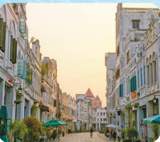
海口一騎樓老街

對香港讀者與旅業而言，1至2小時直航、全年可享的陽光海灘與持續上新的度假內容，正把海南推向「周末出走」「親子休閒」「康養度假」的熱門清單。