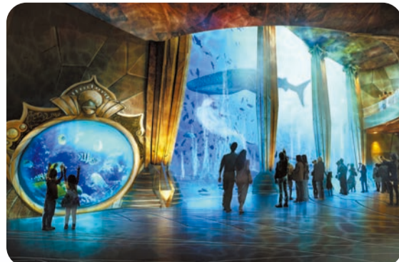
酒店、度假—三亞亞特蘭蒂斯

根據海南省旅遊和文化廣電體育廳的統計，今年1至7月份，香港遊客赴海南旅遊已有85657人次，同比增長了28.8%。對香港讀者來說，海南不僅意味着更便捷的航班和更豐厚的免稅選擇，也代表一種隨